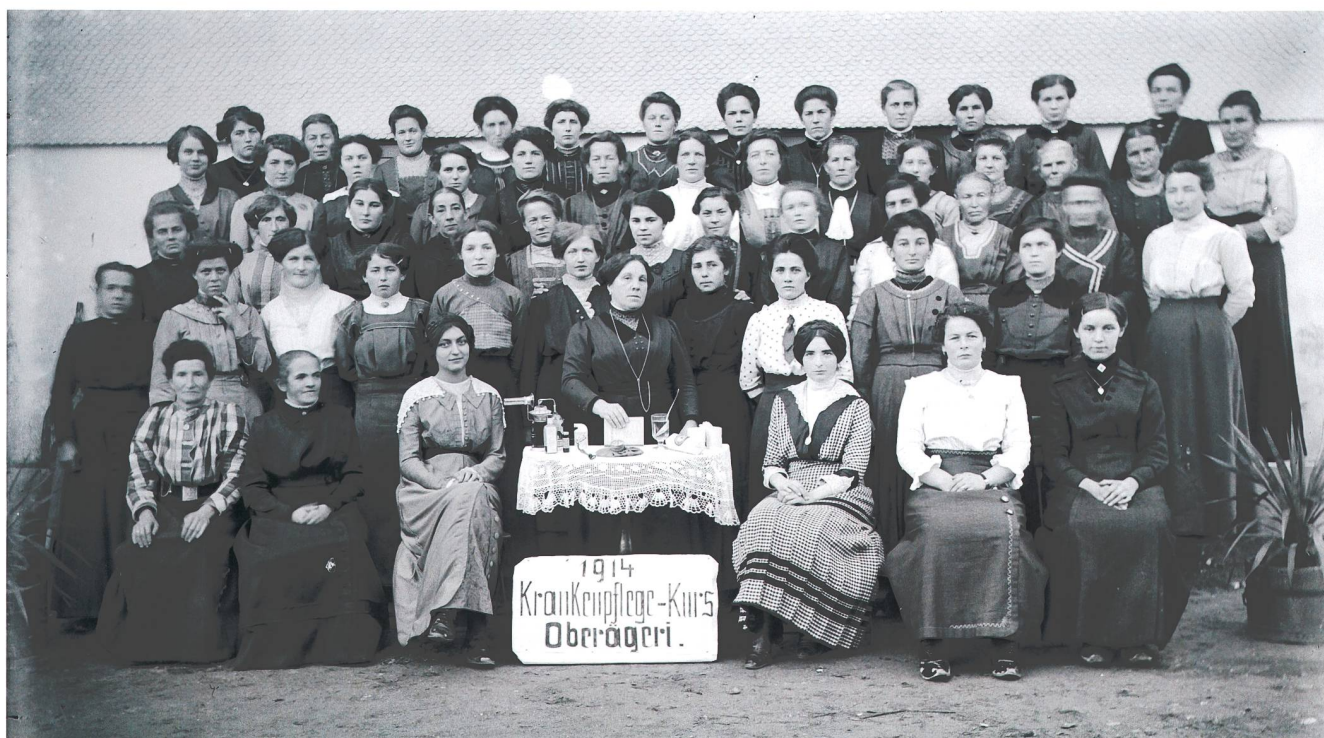
Abb. 4 Krankenpflegekurs in Oberägeri 1914 mit rund sechzig Teilnehmerinnen, organisiert vom «Haushaltverein» mit nur zehn Mitgliedern. Die Bereitwilligkeit, Hilfe zu leisten, war zu Beginn des Kriegs besonders gross. In Zug beteiligten sich rund 120 Teilnehmerinnen sowie einige «Jünglinge» am Kurs des Frauenhilfswerks. In Baar nahmen 62 Frauen und 8 Herren am Kurs des Samaritervereins teil.

und Töchter, «freiwillige Hilfskräfte», sollten sich in der «Anmeldezentrale für den Kanton Zug» im Marienheim in der Zuger Altstadt melden, Anmeldestellen in den Gemeinden würden später bekannt gegeben.