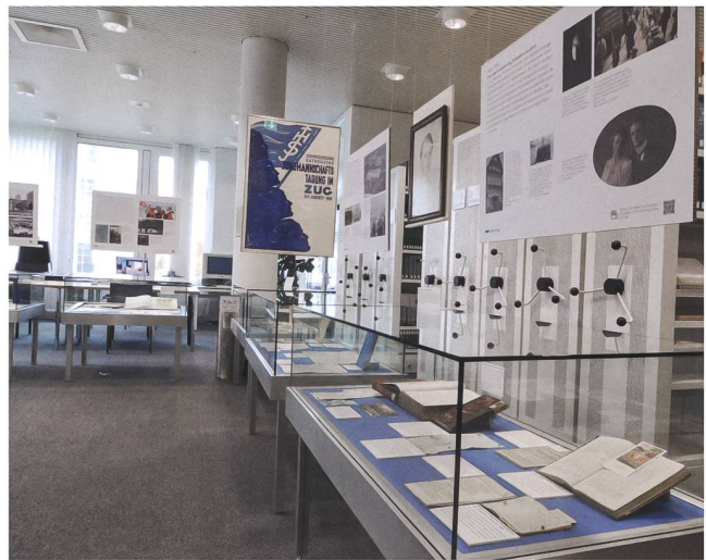
Abb. 3 Die Kabinettausstellung «Der ewige Bundesrat» über Philipp Etter von 2020 umfasste sieben Vitrinen mit Archivalien insbesondere aus dem Staatsarchiv Zug.