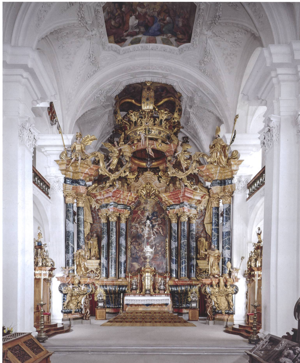
Abb. 5 Rheinau, ehemalige Klosterkirche. Im Hochaltar, errichtet 1720 bis 1723 von Judas Thaddäus Sichelbein aus Wangen im Allgäu, sind verschiedene formale Elemente vorgebildet, die sich im Neuheimer Entwurf wiederfinden.