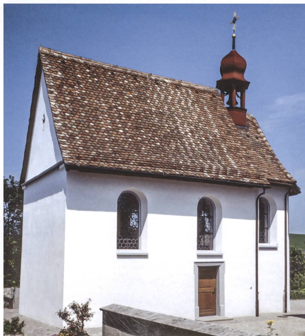
Abb. 1 Die 1724 auf Ansinnen der Kirchengenossen von Neuheim errichtete Friedhofskapelle ersetzte einen Vorgängerbau, der bereits Anfang des 16. Jahrhunderts bestanden hatte.

Der Altarriss, eine Federzeichnung, zeigt die Front eines Altars mit Andeutung des dreiseitigen Grundrisses der Altarnische und des Gewölbes darüber. Unten links befindet sich eine grundrissliche Andeutung der Säulenstellung, die allerdings keine axiale Übereinstimmung mit dem Aufriss aufweist. Am linken Rand wird ein Massstab über 16 Schuh, rechts in Bleistift angedeutet. Das viersäulige Retabel mit äusserem, gewundenem Säulenpaar über nach oben ausladenden Volutenkonsolen erhebt sich über dem «altarstein», der beidseitig durch Anbauten verbreitert ist, deren einer als «kestli» bezeichnet wird. Die Breite des bereits bestehenden