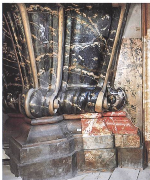
Abb. 4 Rheinau, ehemalige Klosterkirche. Blau gelüsterte und rot-gelbe, achatartige Fassung an den Sockelvoluten, wie sie auf der Neuheimer Altarzeichnung beschrieben ist.