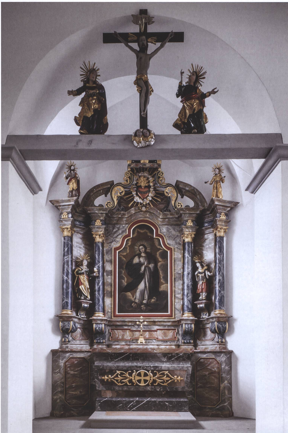
Abb. 6 Neuheim, Friedhofkapelle. Der ausgeführte Altar weicht zwar vom Entwurf ab, der aber offensichtlich den Ausgangspunkt für die endgültige Gestaltung bildete. Die Säulen sind nun gleichförmig gerade und so weit auseinander gerückt, dass dazwischen die im Entwurf genannten Figuren Platz finden.

Eine weitere Ungereimtheit fällt erst auf, wenn man die Zeichnung wiederholt betrachtet: Das Retabel selbst ist mit einer feinen Feder und recht sorgfältig ausgeführt. Dazu passt die feine, zentriert angebrachte Legende darüber. Der Unterbau hingegen zeigt eine gröbere Hand. Es scheint, dass zuerst nur der Altarstein gezeichnet war und dass die seitlichen Erweiterungen recht unexakt nachträglich angefügt wurden. Die mit dem Lineal gezogenen Linien sind weniger fein,