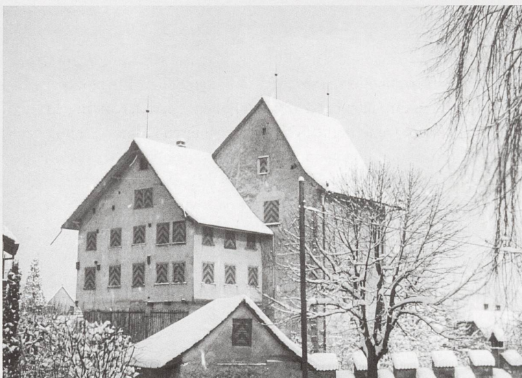
Abb. 1 Die für das Fachwerkgebäude charakteristischen Holzbalken der Burg waren damals noch unter einer Schicht Verputz verborgen und wurden erst später freigespitzt.

zu schaffen», wie ein Spendenaufruf beteuerte, der am 3. Dezember in den Zuger Nachrichten erschien. Gesucht wurden Betten, Kinderbetten, Tische, Stühle, Kasten, Kommoden, Bett-, Tisch-, Küchen- und Toilettenwäsche, Woll- und Couchdecken, Vorhänge, Teppiche, Küchen- und Essgeschirr sowie Besteck. Ausserdem Werk-, Näh- und Spielzeug und ein holzbefuerter Waschklofen. Das Material wurde auf Wunsch abgeholt oder konnte jeden Tag ab 16 Uhr vor Ort abgegeben werden.