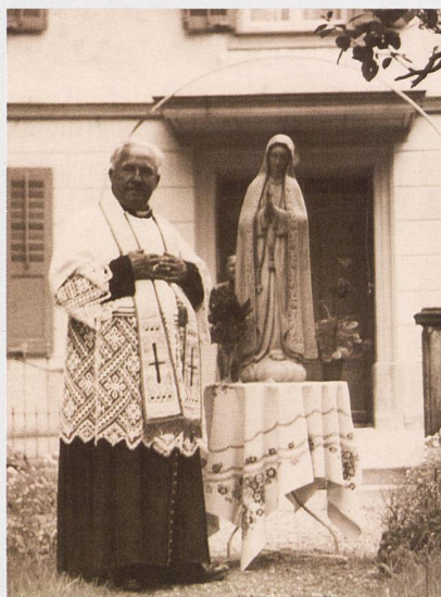
Abb. 3 Der Geistliche in vollem Ornat bei einer liturgischen Handlung unter freiem Himmel.