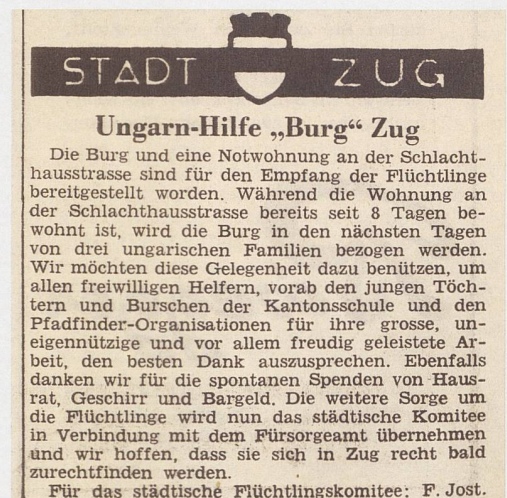
Abb. 2 Die Sammelaktion stiess auf grosses Echo, sodass das städtische Flüchtlingskomitee schon am 21. Dezember in den Zuger Nachrichten von der Einquartierung dreier ungarischer Familien in der Burg berichten konnte.