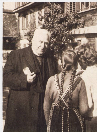
Abb. 4 Der geistliche Würdenträger aus dem Ausland im Gespräch mit Passantinnen.