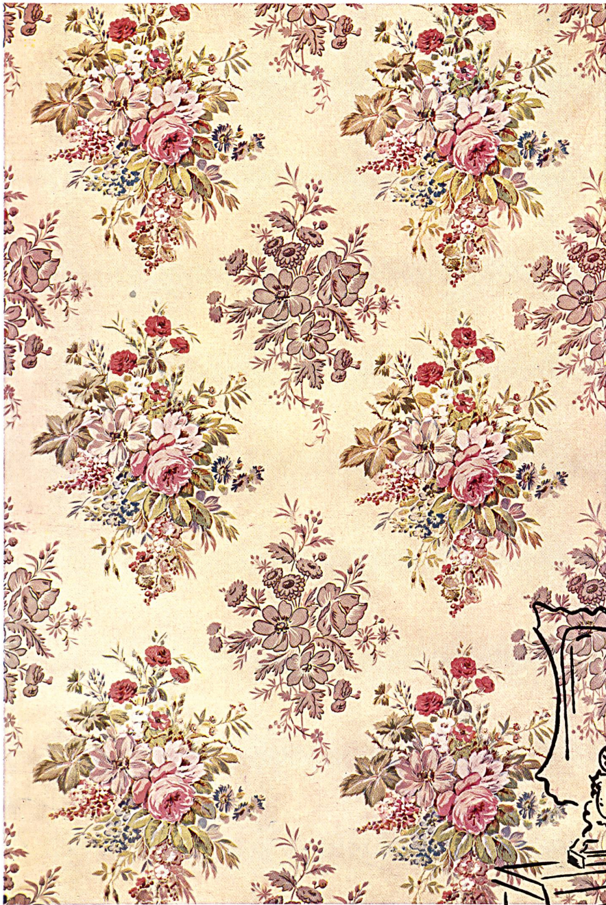
Chintz aus den Fabrikationsbetrieben der Firma Stoffel & Co., St. Gallen.