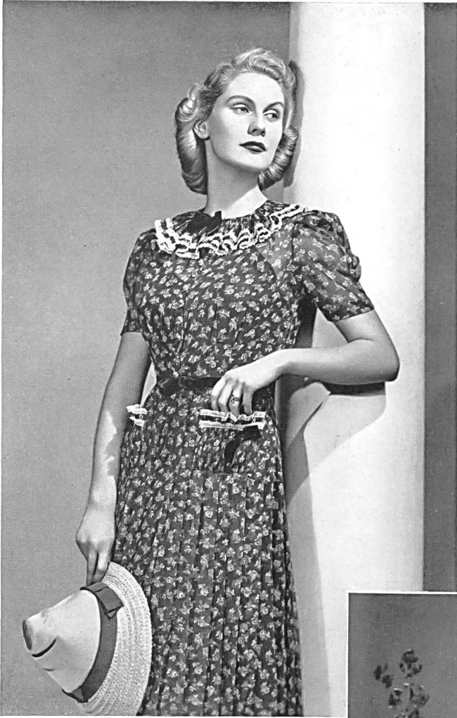
Bedrucktes Ausgangskleid aus Schweizer Voile. Modell Alper, New York.

Dem wundersam zarten Organdi bleibt die Mode stets treu und schneidert sich daraus die allertzückendsten Modelle mit demselben unwirklichen, berückenden Duft: in weiss mit Reliefstickerei und durchsichtigen Regenbogenfarben, in milden und weichen Tönen für sömmerliche Nachmittags- und Abendtoiletten. Und erst die jugendlichen und kecken Bluschen, so hauchdünn und fein, gar nicht zum glauben. Endlich die Jabots, plissierten Gempen, kleinen Schmetterlingsmaschen, Poschettchen, Ansteckblumen aus feinem Linon, die dem Kleid die letzte Vollen- dung geben.