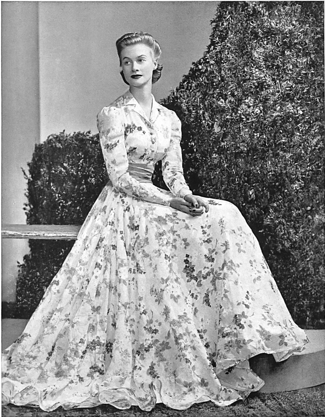
Abendkleid aus Schweizer Organdi. Modell Herbert, New York.

Die modernen Wohnungen sind kokett eingerichtet, die ganze Aufmachung hat ein junges und frohes Gesicht, sachlich, einfach und geschmackvoll. Dazu passen nun die neuen Möbel- und Vorhangstoffe ausgezeichnet, die hübschen Kollektionen strapazierfähiger, billiger und erprobter Spezialgewebe, die zudem nicht heikel sind. Der moderne Innenarchitekt wählt für Vorhänge Perkal, Voile, Tüll und Marquisette, die das Licht wirkungsvoll filtern. Er ziert die Fenster so einfach wie möglich in weiss, crème, rosa und zuweilen mit ein paar diskreten Blumenmustern.