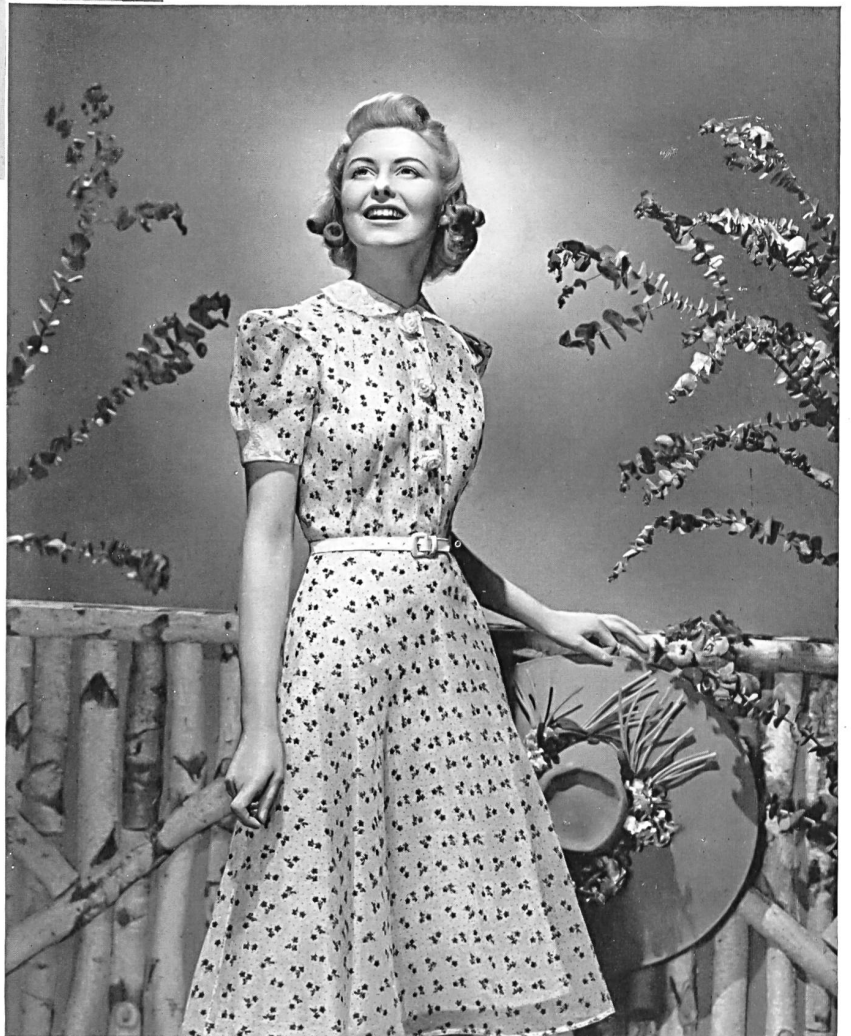
Kleid aus durchsichtigem Schweizer Organdi. Modell Famous Blouses, New York.

Dem wundersam zarten Organdi bleibt die Mode stets treu und schneidert sich daraus die allertzückendsten Modelle mit demselben unwirklichen, berückenden Duft: in weiss mit Reliefstickerei und durchsichtigen Regenbogenfarben, in milden und weichen Tönen für sömmerliche Nachmittags- und Abendtoiletten. Und erst die jugendlichen und kecken Bluschen, so hauchdünn und fein, gar nicht zum glauben. Endlich die Jabots, plissierten Gempen, kleinen Schmetterlingsmaschen, Poschettchen, Ansteckblumen aus feinem Linon, die dem Kleid die letzte Vollen- dung geben.