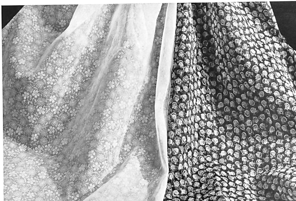
Kleiderstoffe von Taco A.-G., Zürich.

Die Schweizer Kollektionen sind stets abwechslungsreich und werden auf jede Saison erneuert. Neben den beliebten klassischen Mustern überraschen uns jedesmal eine Reihe hochmoderner Schöpfungen. Diesen wie jenen sieht man es an, sie wurden mit Geschmack ausgelesen und mit viel Sorgfalt hergestellt: lauter Artikel erster Qualität.