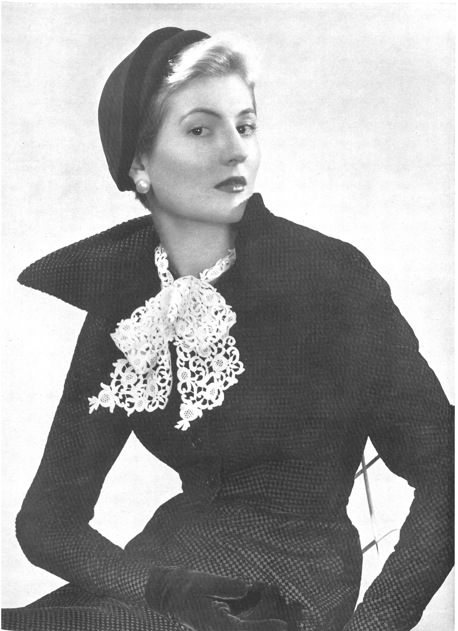
JACQUES FATH Union S. A., St-Gall PIERRE BRIVET FILS, PARIS