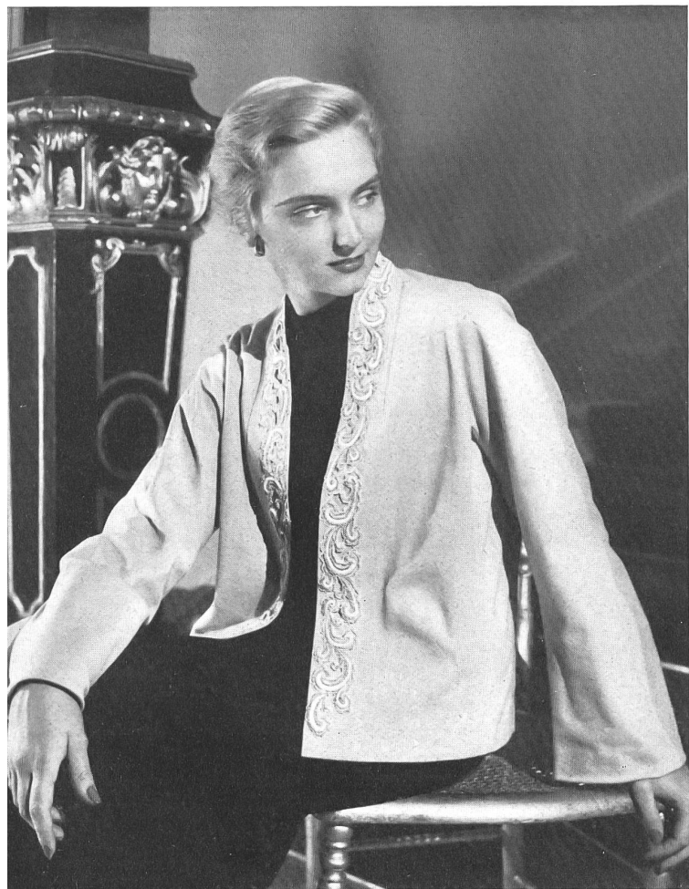
PERLENE Hufenus & Cie, St-Gall PIERRE BRIVET FILS, PARIS