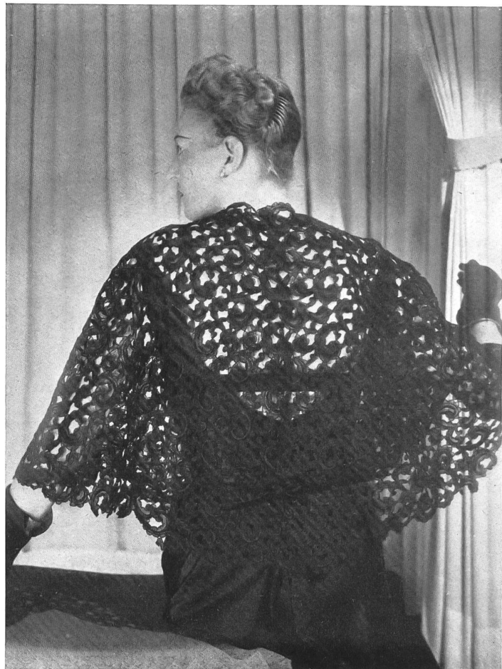
RAPHAEL Hufenus & Cie, St-Gall PIERRE BRIVET FILS, PARIS