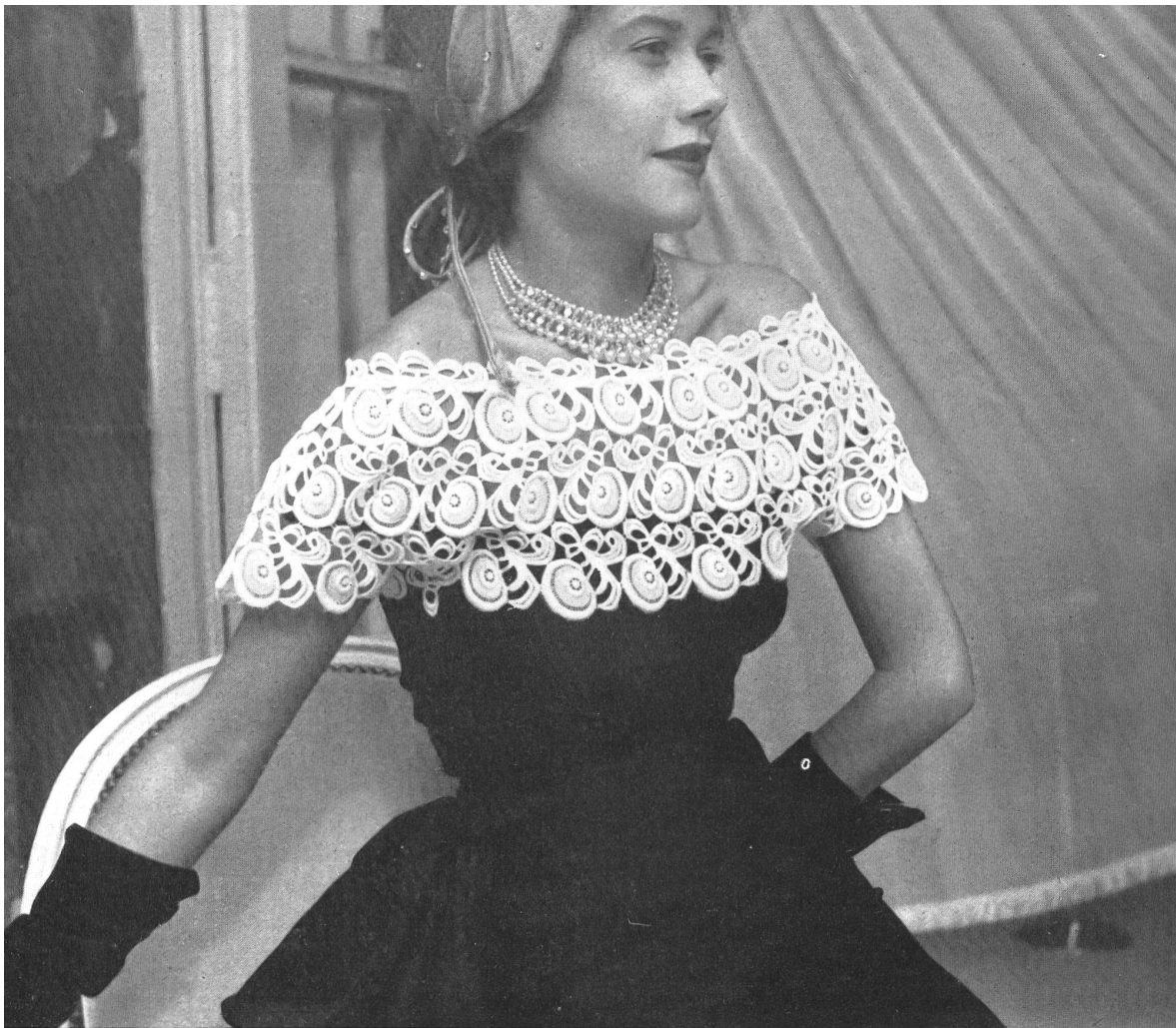
MAGGY ROUFF Union S.A., St-Gall PIERRE BRIVET FILS, PARIS