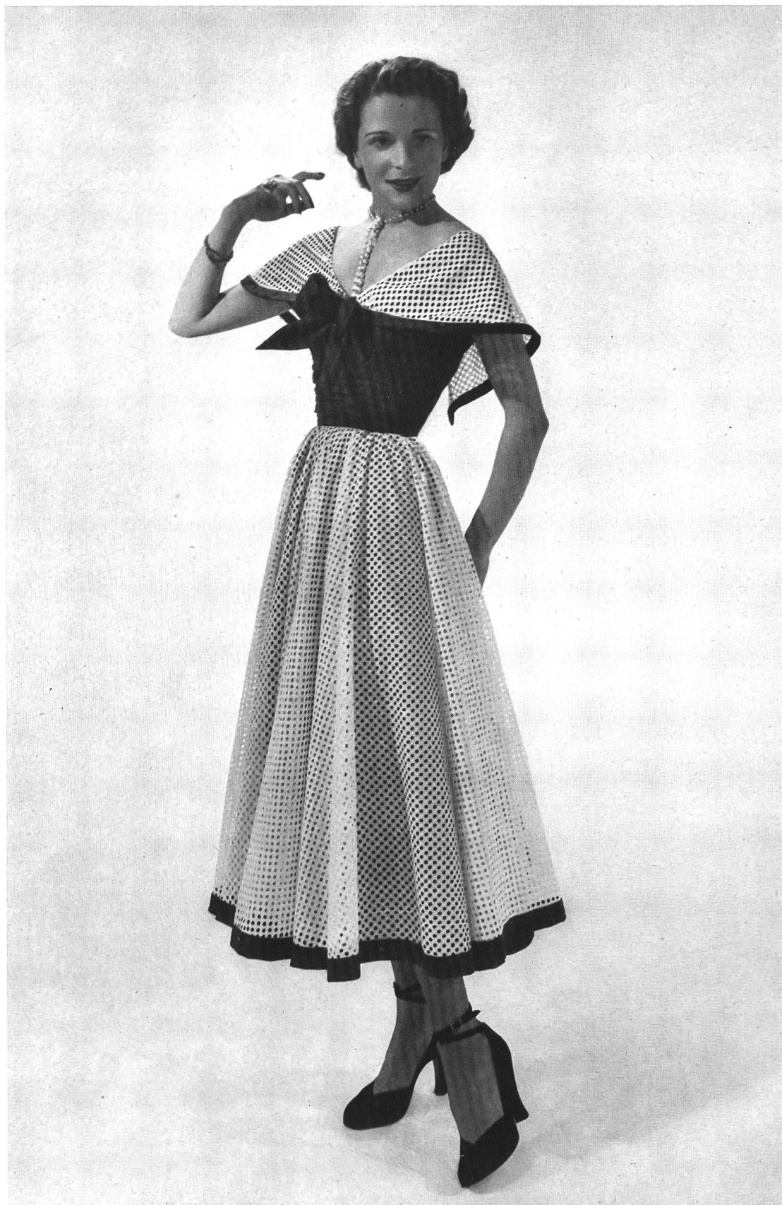
NINA RICCI J. G. Nef & Cie, Hérissau GUITRY, PARIS