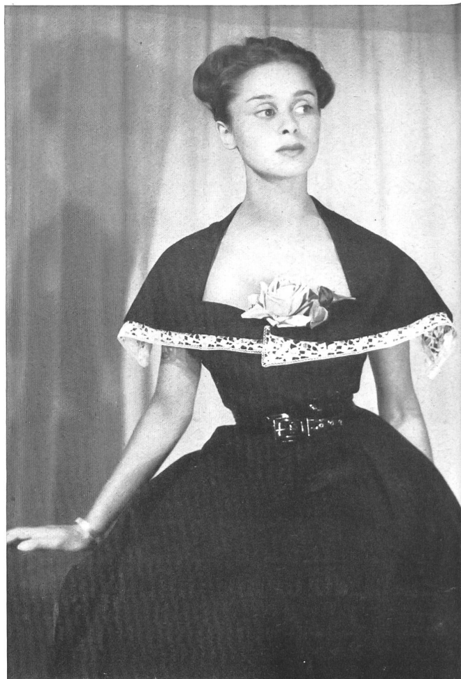
PIERRE BALMAIN Forster Willi & Cie, St-Gall PIERRE BRIVET FILS, PARIS