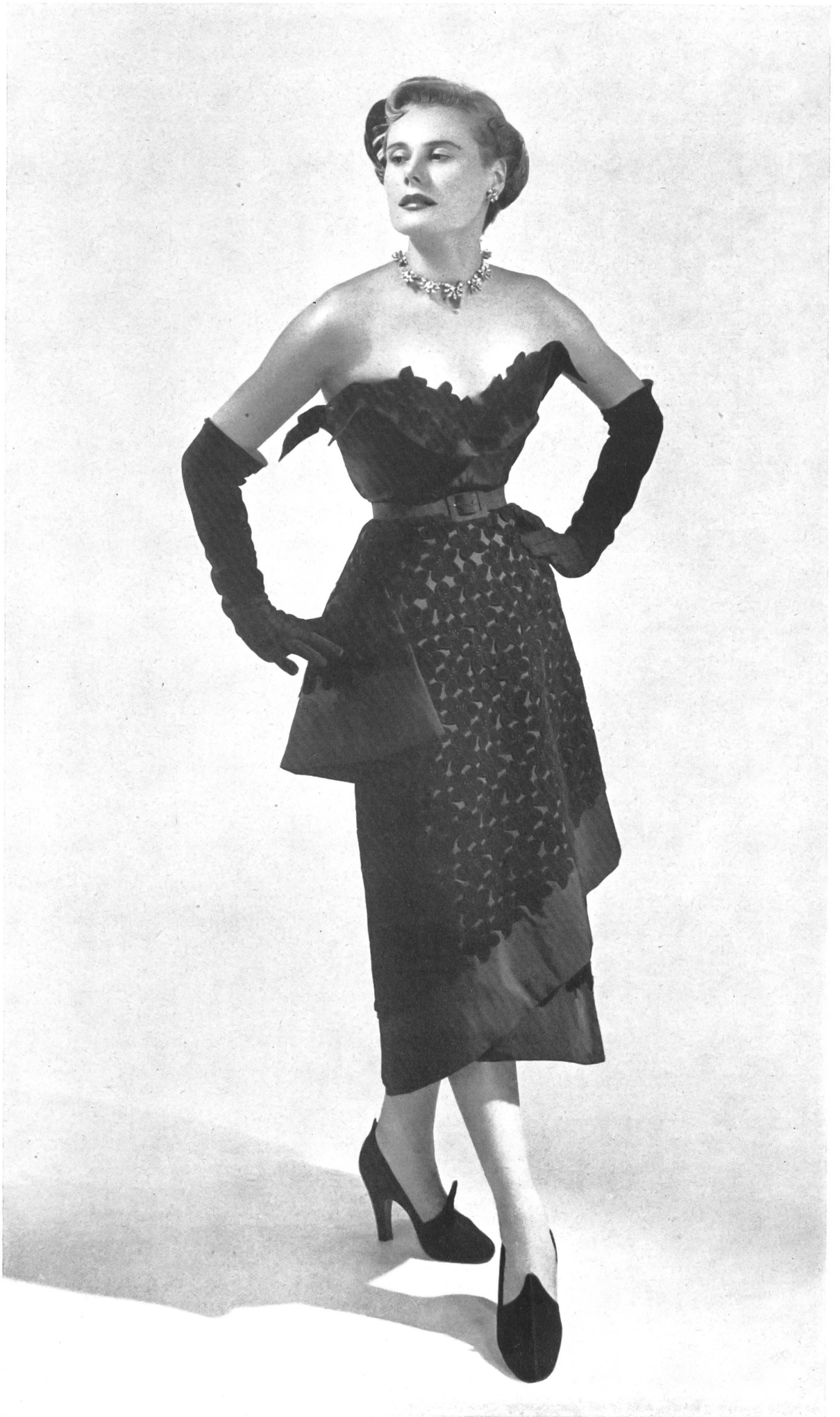
JEAN DESSÈS Forster Willi & Cie, St-Gall THIÉBAUT-ADAM, PARIS