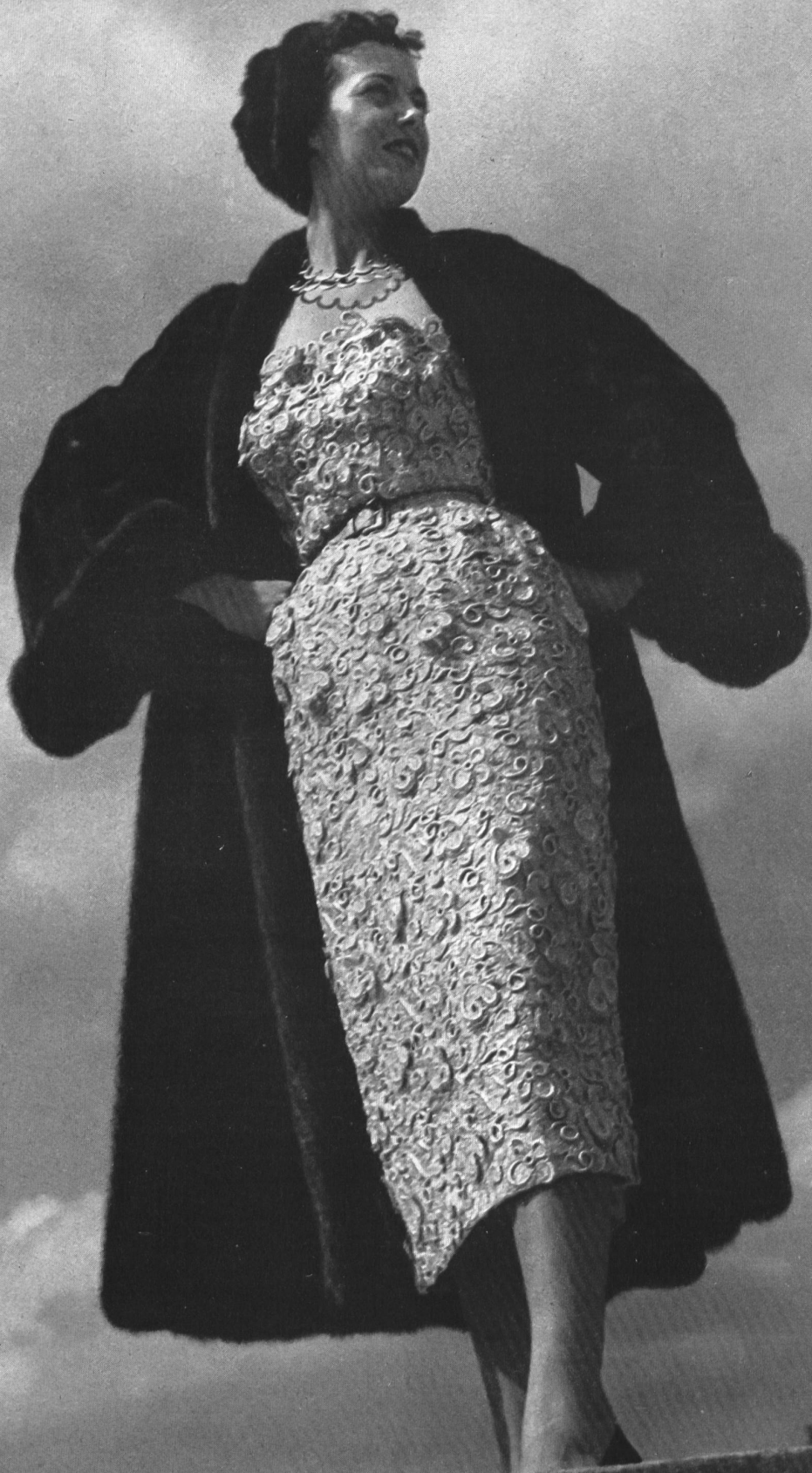
CHRISTIAN DIOR Forster Willi & Cie, St-Gall INAMO, ZURICH