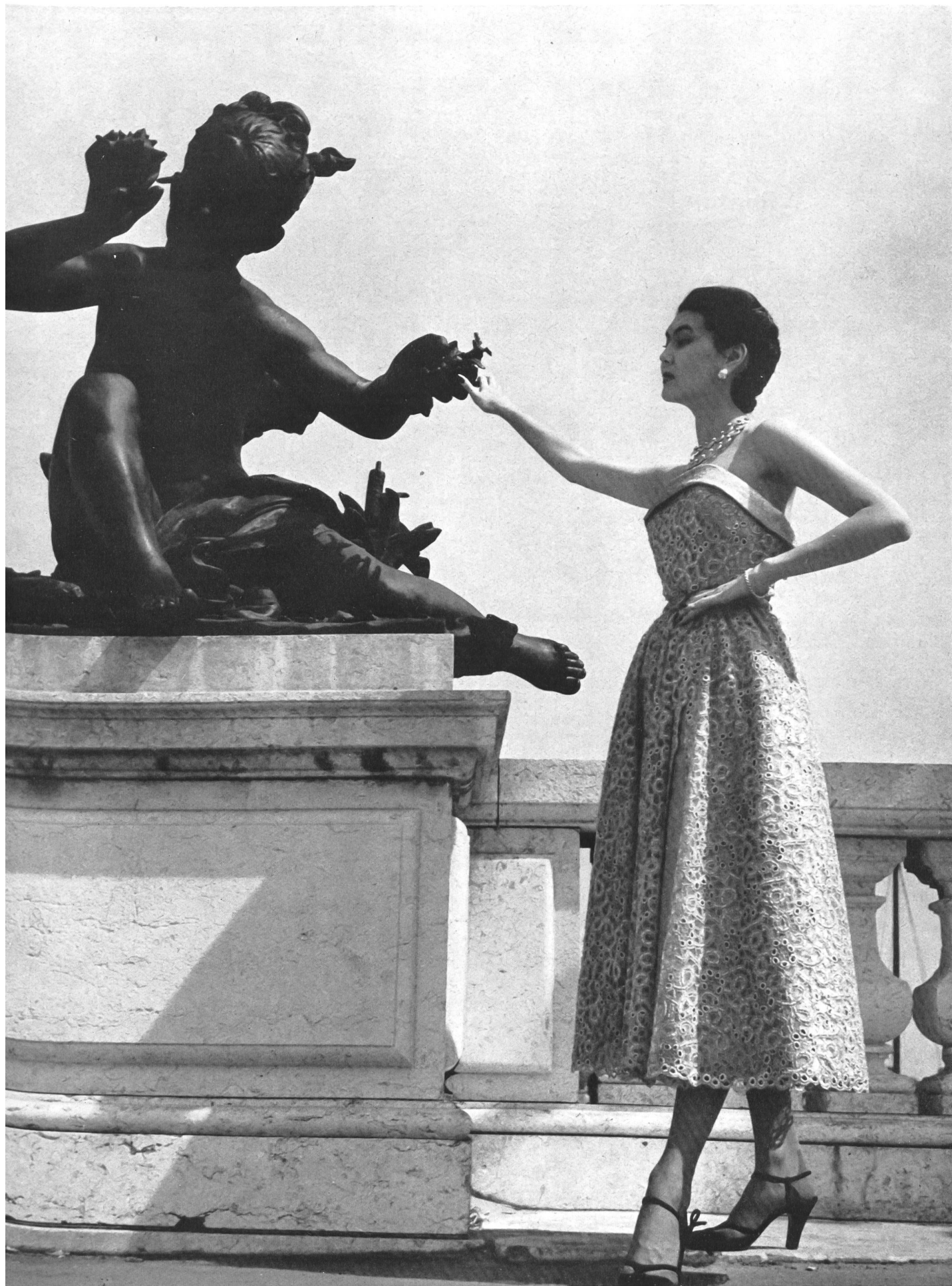
CHRISTIAN DIOR A. Naef & Cie, Flawil INAMO, ZURICH