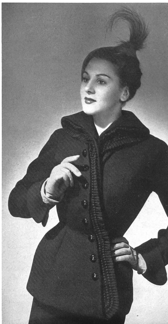
MARCEL ROCHAS Forster Willi & Cie, St-Gall THIÉBAUT-ADAM, PARIS