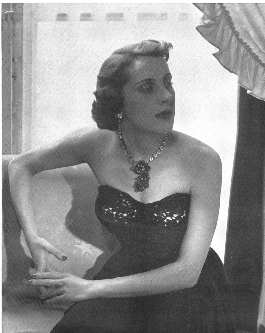
SCHIAPARELLI Walter Schrank & Co., St-Gall THIÉBAUT-ADAM, PARIS