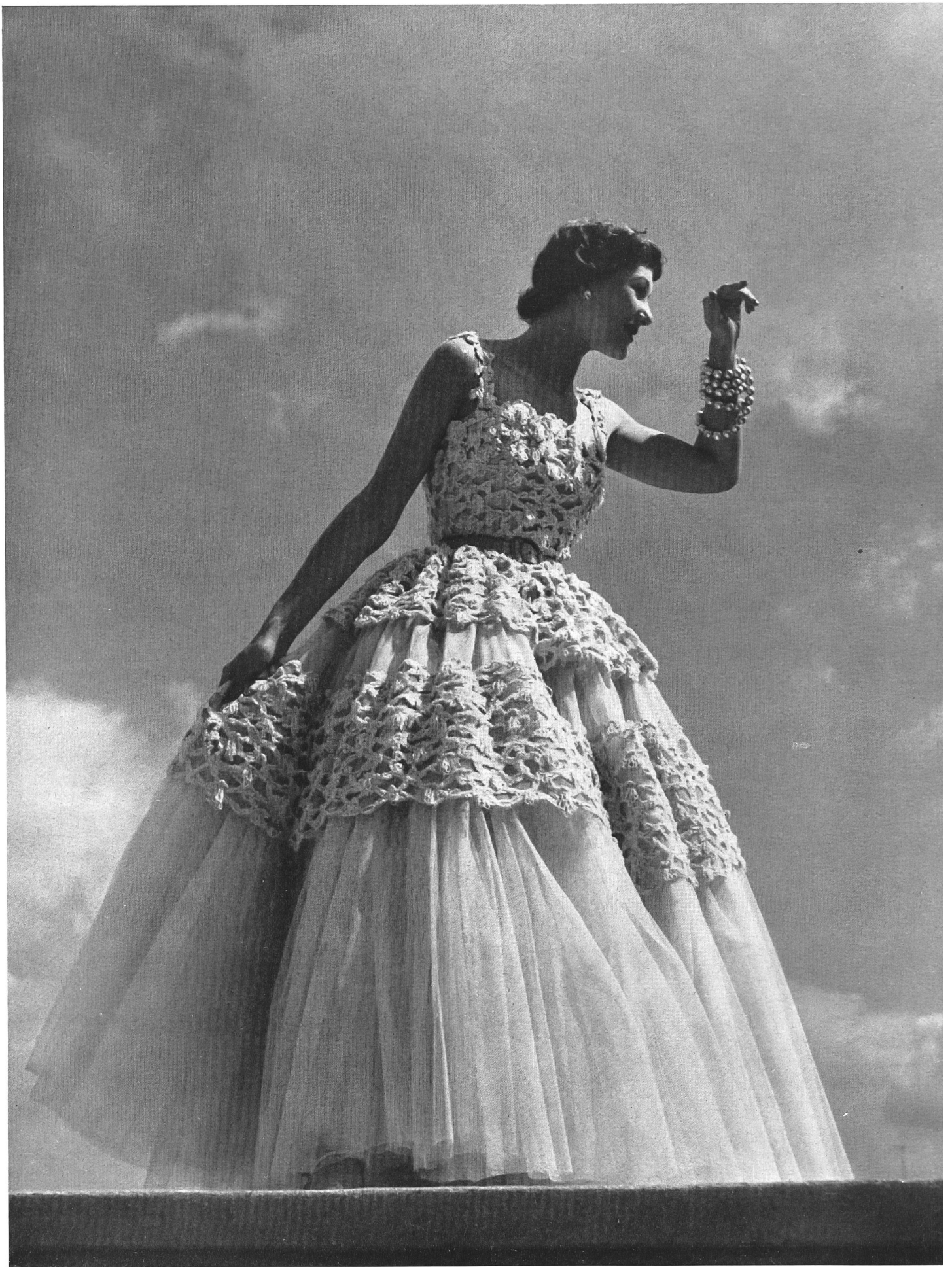
CHRISTIAN DIOR A. Naef & Cie, Flawil INAMO, ZURICH