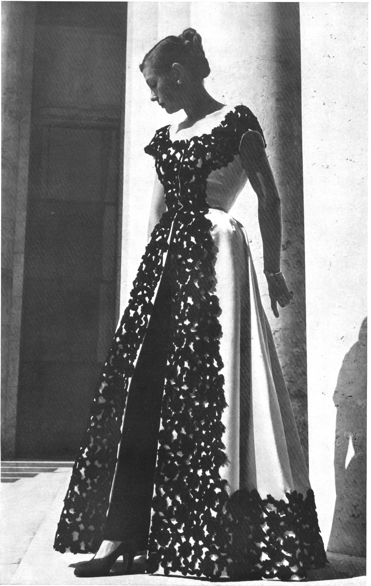
BALENCIAGA A. Naef & Cie, Flawil INAMO, ZURICH