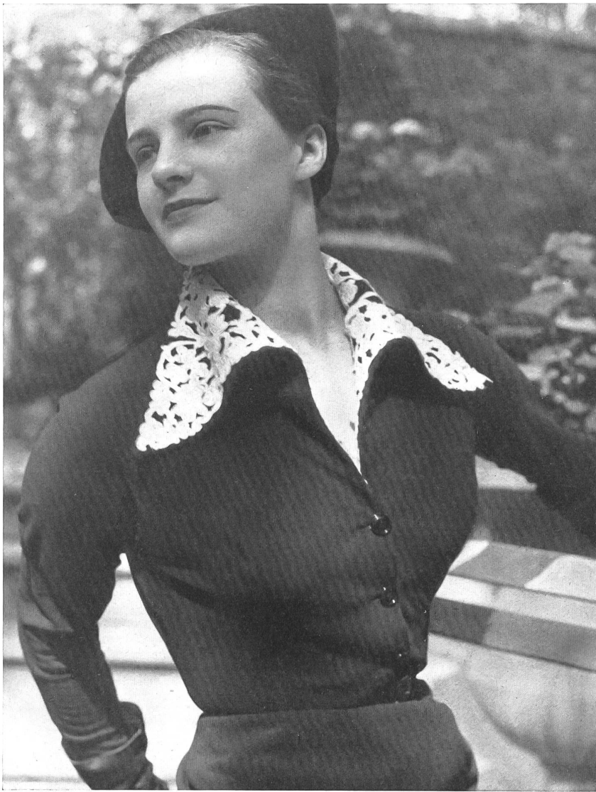
JACQUES FATH Hufenus & Cie, St-Gall PIERRE BRIVET FILS, PARIS