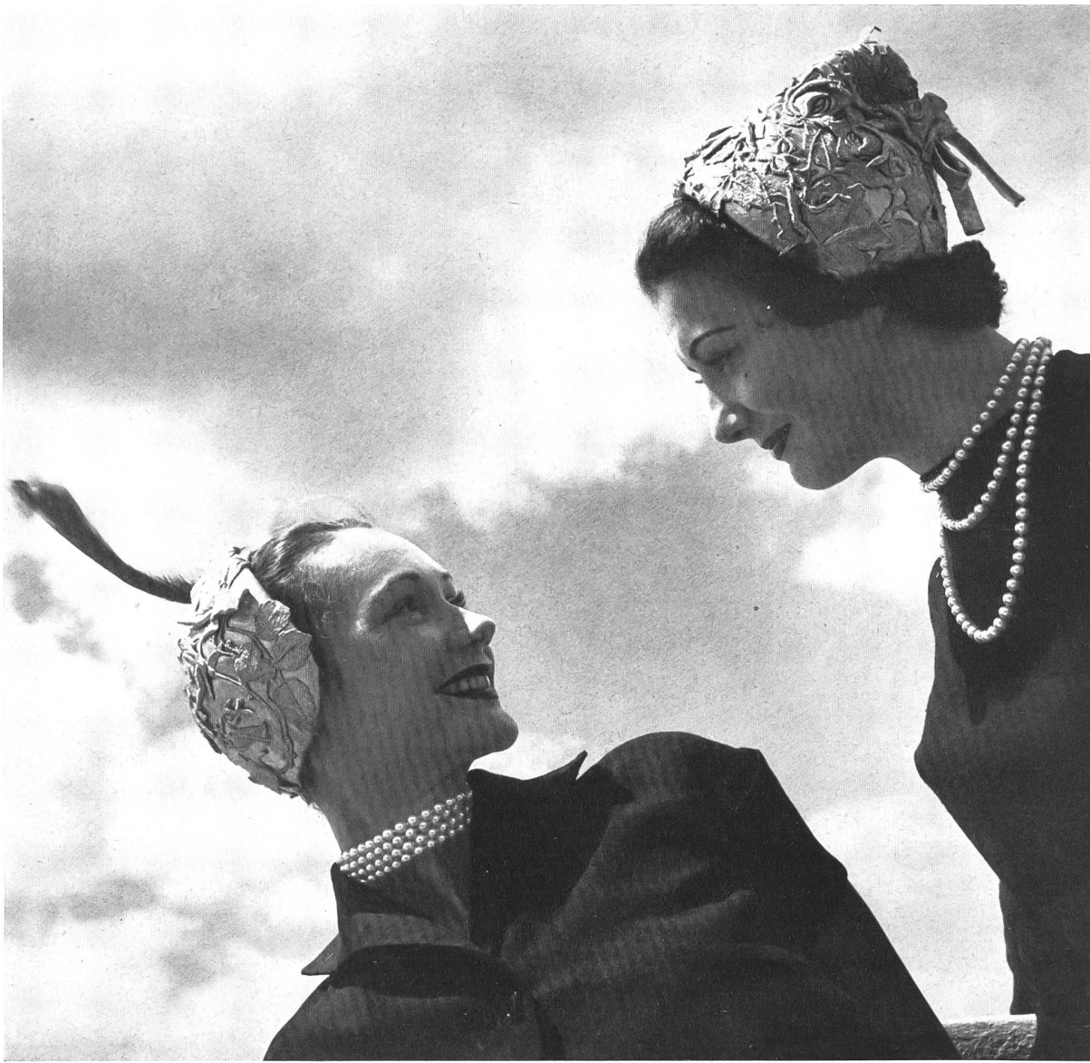
LEGROUX SOEURS Forster Willi & Cie, St-Gall INAMO, ZURICH