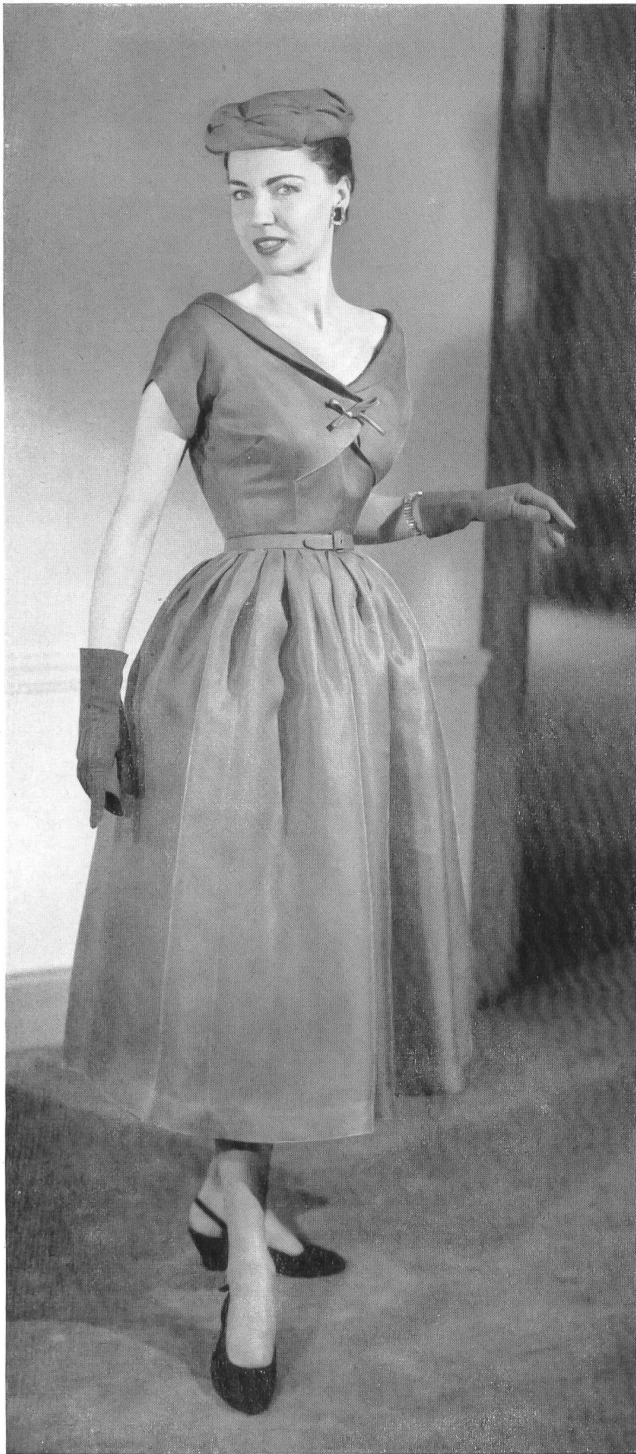
CHRISTIAN DIOR, NEW YORK " Strobi soie "

from L. Abraham & Co. Silks Ltd., Zurich.