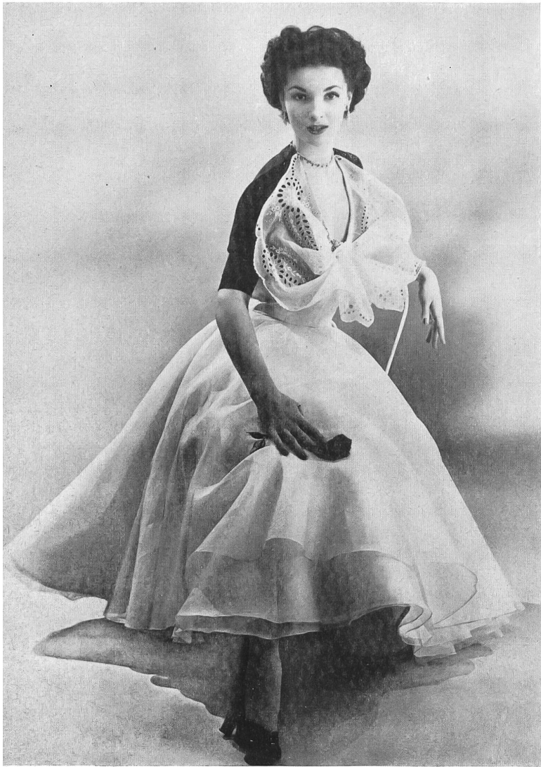
A short black and white dance dress in sheer Swiss organdy with a huge butterfly bow of eyelet embroidered organdy; brief jacket of black taffeta, by Castillo exclusive for Nanty Frocks .