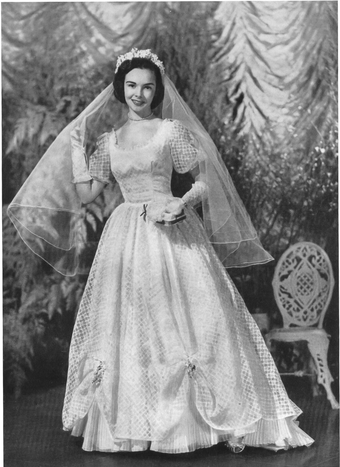
SWISS FABRIC GROUP, NEW YORK A wedding gown in a wonderful sheer novelty Swiss cotton by Ruth For- mals.

Im Waldorf Astoria in New York fand dieses Frühjahr eine beachtenswerte, von der « Swiss Fabric Group » organisierte « Fashion Show » statt, an welcher den Vertretern der amerikanischen Presse und den Leitern von Konfektionshäusern eine Serie ausschliesslich aus schweizerischen Stoffen und Stickereien hergestellter Kleider, Blusen und Wäschestücke vorgeführt wurde.