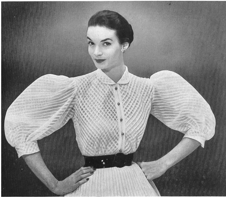
Gibson blouse in a novelty Swiss voile with transparent and opaque stripes separated by drawnthread work, by Frances Sider .

batist mit Quadraten aus nicht oxydierenden Goldfäden; Honans aus ägyptischer Baumwolle; glänzende, broschierte und beidseitig verwendbare Baumwollsatins; Challis de Laine mit Kaschirmustern für Bauernjupes, wie sie die college girls lieben. Mit Durchbruchstreifen bestickte Organdis sind mit Blumenbouquets in Pastell-tönen bedruckt. Dieses Zusammenklingen von Stickerei und Druck hat einen sehr originellen und neuartigen Effekt gezeitigt. Eine amüsante ländliche Szene mit Herden, Häusern und Bauern zieht sich über die ganze Länge eines grünen Organdijupes. Matelassierte, aber trotzdem feine Stoffe eignen sich ausgezeichnet zu ebenso leichten wie komfortablen Ensembles für den Aufenthalt im Freien. Ein besonders geschmackvolles Kleid bestand aus sehr geschmeidigem, stark glänzendem schwarzem Chintz mit feinen weissen Streifen. Organdi wird mit Geschick verarbeitet, und an Material wird bei den weiten Rücken, denen 4 Lagen aus dem gleichen weissen Organdi die Durchsichtigkeit von feinem Chinaporzellan verleihen, tatsächlich nicht gespart. Stickereien aus Cellophanstroh, Soutache und Raphia ergeben Relief-effekte an Kleidern aus uni Organdi.