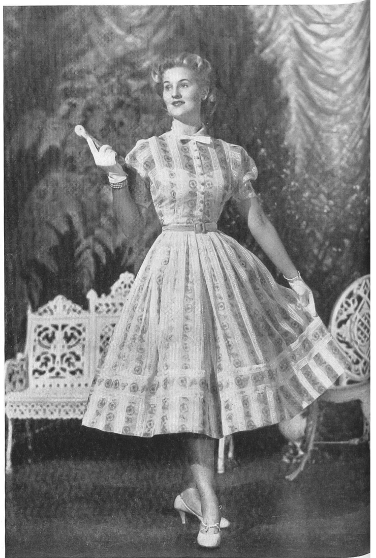
Shirtwaist dress in a panel-printed and embroidered organdy with pale blue velvet collar, buttons, belt and a taffeta slip to match with the colour of the hand-printed design, by Countess Alexander .