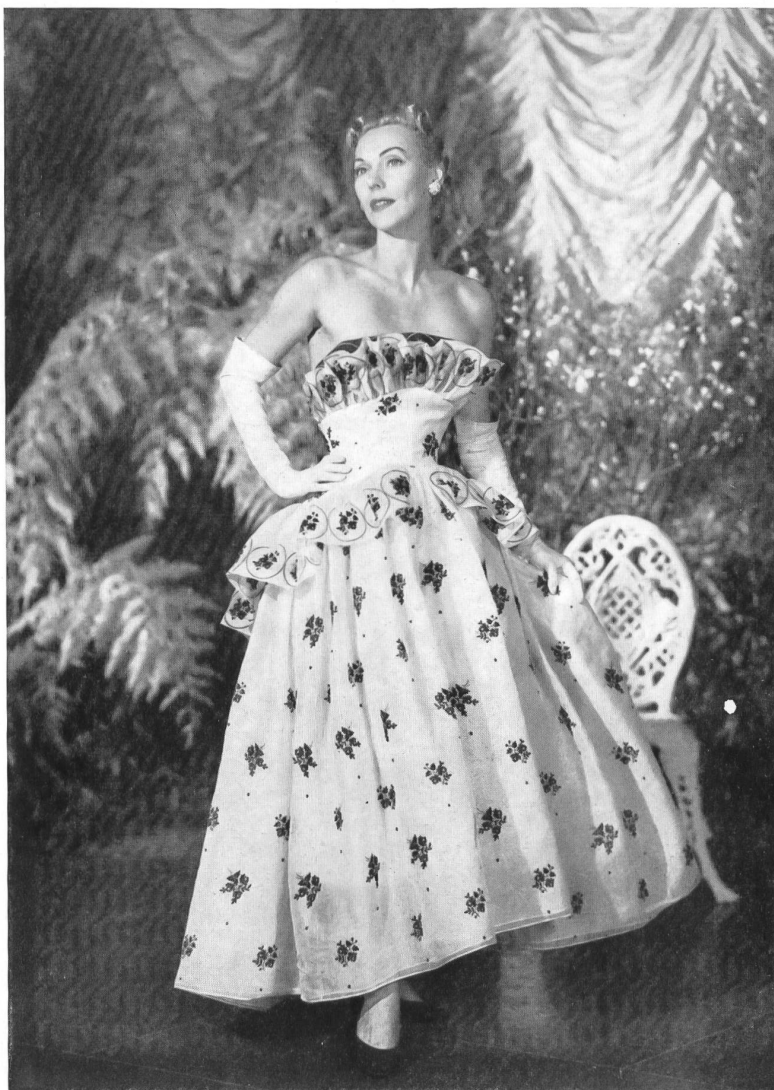
Evening dress in snowy white transparent Swiss organdy with navy blue embroidered nosegays by Howard Greer, California.