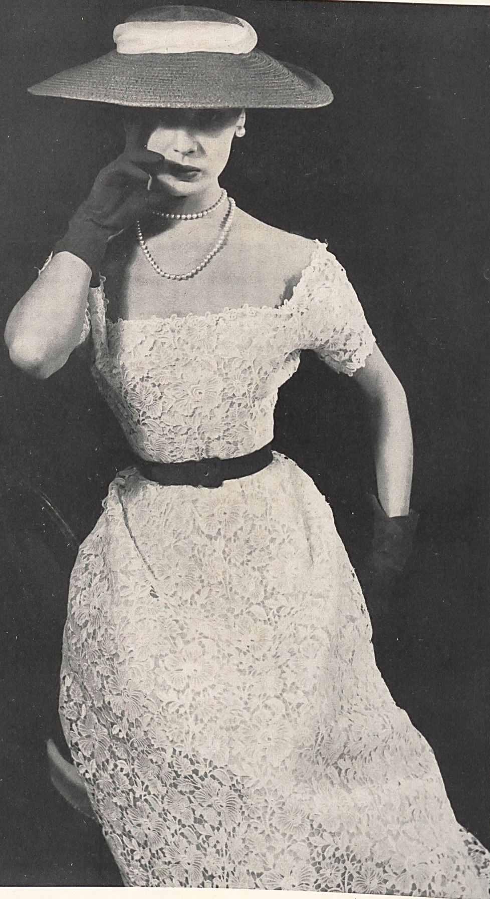
CHRISTIAN DIOR Dentelle de guipure de Forster Willi & Cie, St-Gall grossiste à Paris : Pierre Brivet S. à r. l.