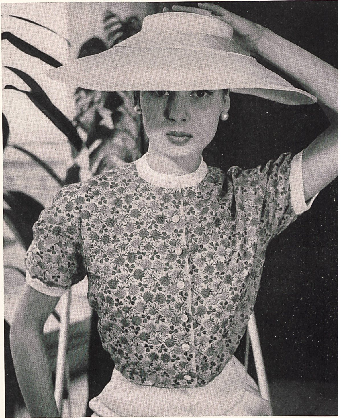
CHRISTIAN DIOR Trèfles brodés couleurs de Union S.A., St-Gall ; grossiste à Paris : Chatillon, Mouly, Roussel S.A.