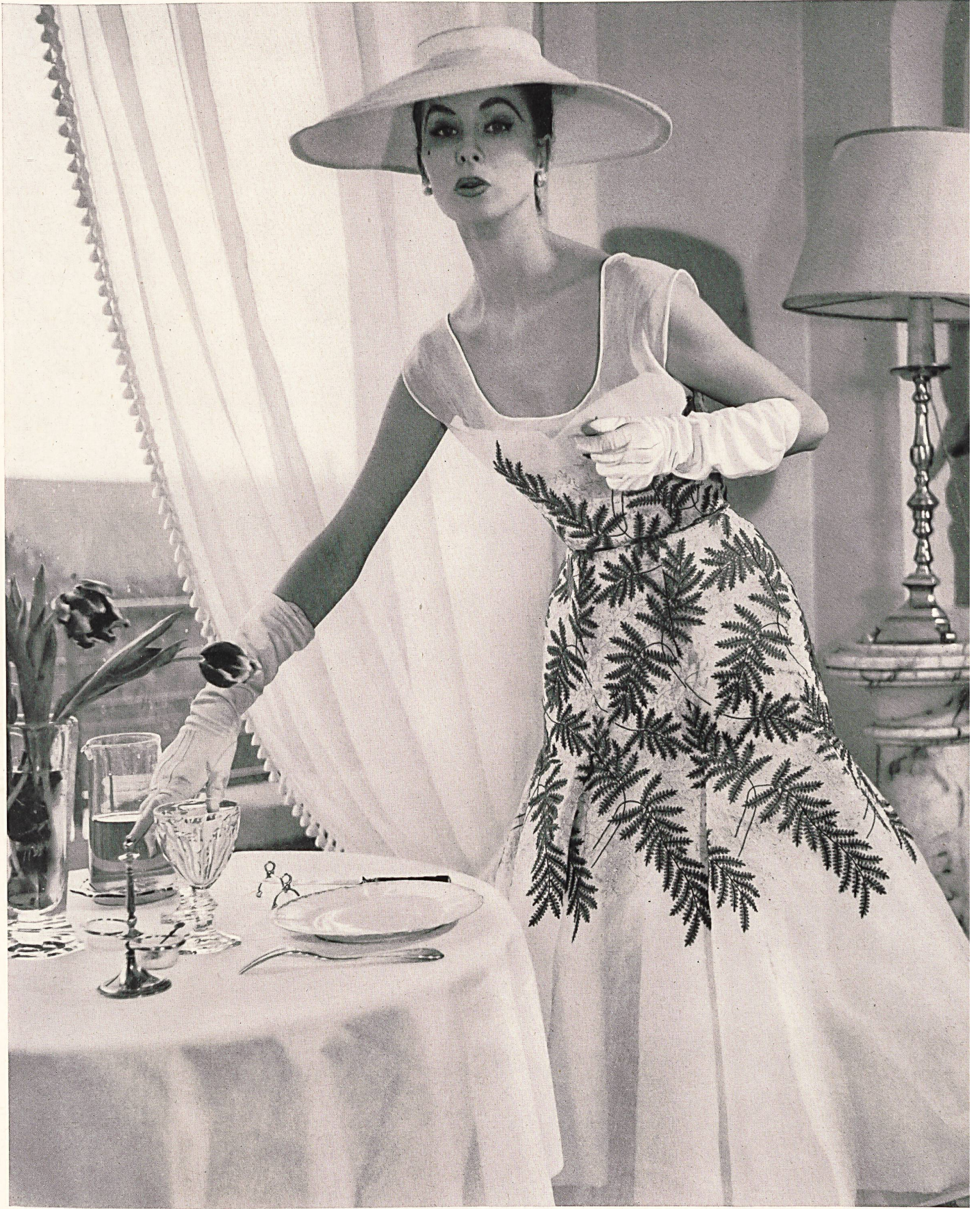
JACQUES HEIM Fougères brodées couleurs de Union S. A., St-Gall ; grosiste à Paris : Chatillon, Mouly, Roussel S. A.