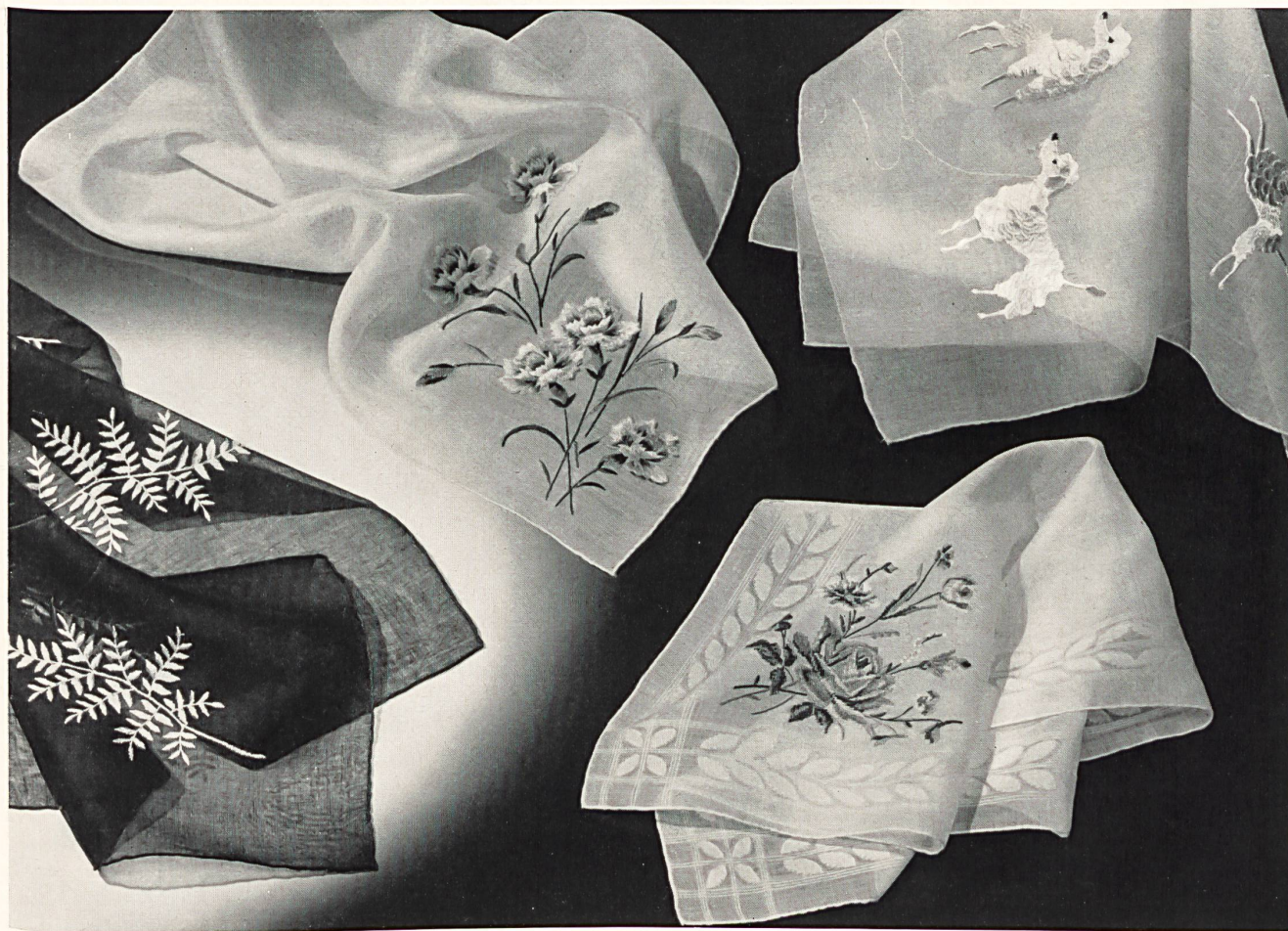
Union S. A., Saint-Gall

Quelques échantillons de la riche collection de mouchoirs brodés.