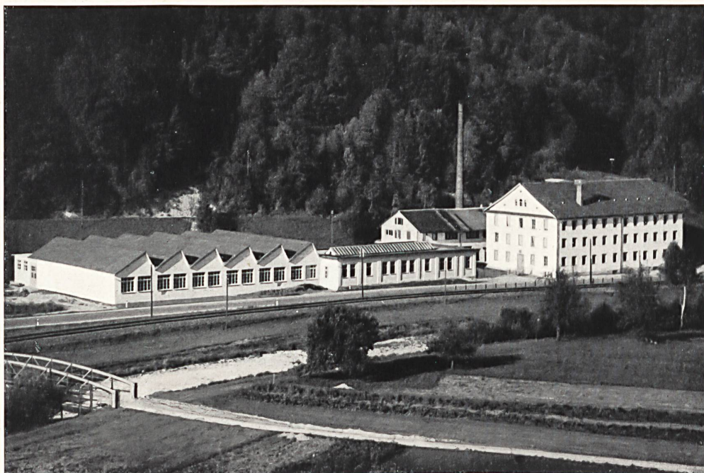
Weberei der Fa. J. G. Nef & Co. A.-G. in Bauma.