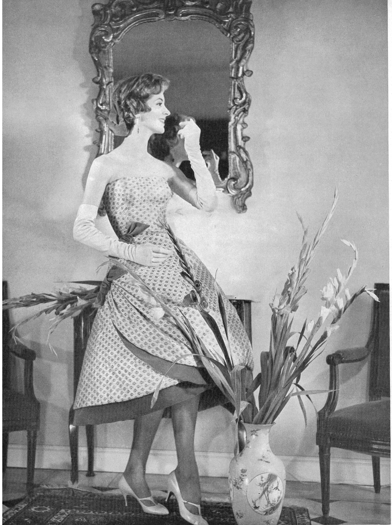
JACQUES HEIM Tissu de Stehli & Co., Zurich