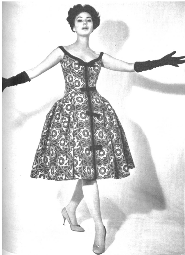
JACOB ROHNER S.A., REBSTEIN