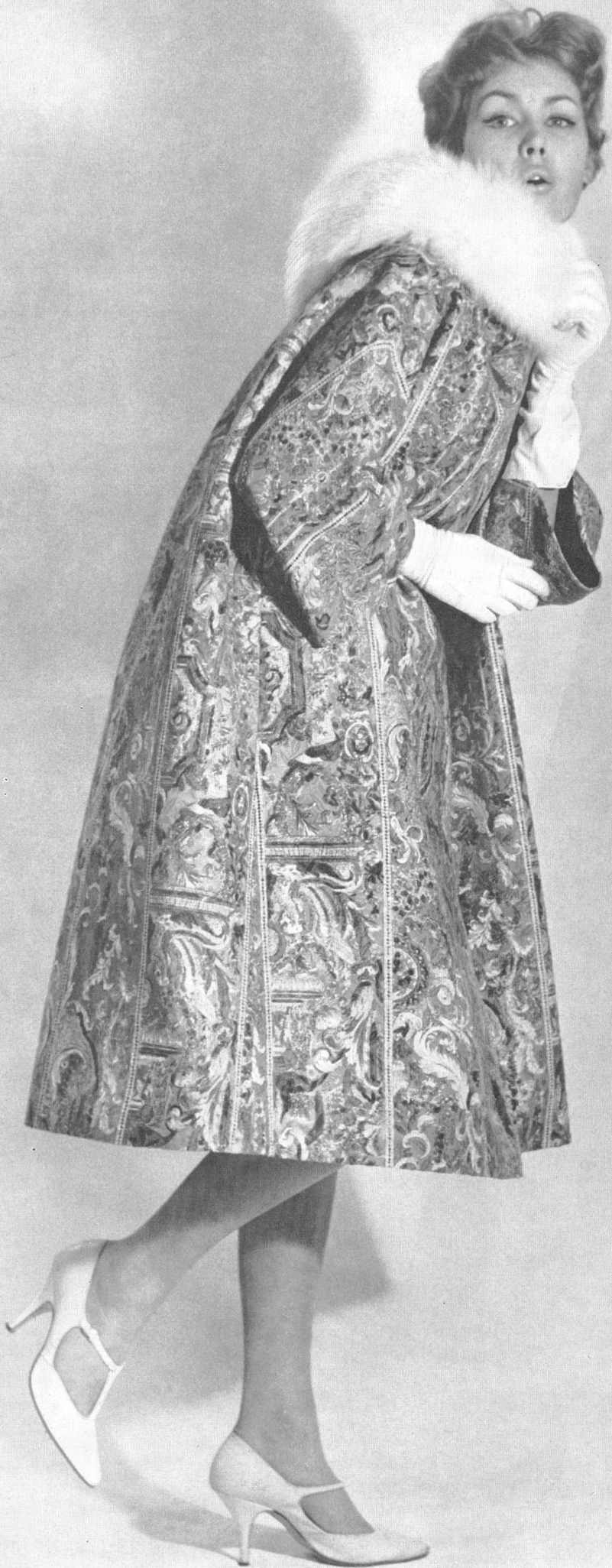
METTLER & CIE S.A., SAINT-GALL Brocart jacquard et or avec motifs Renaissance imprimés Gold-Brocade-Jacquard mit bedruckten Renaissance- Mustern Modèle : Heinz Oestergaard, Berlin