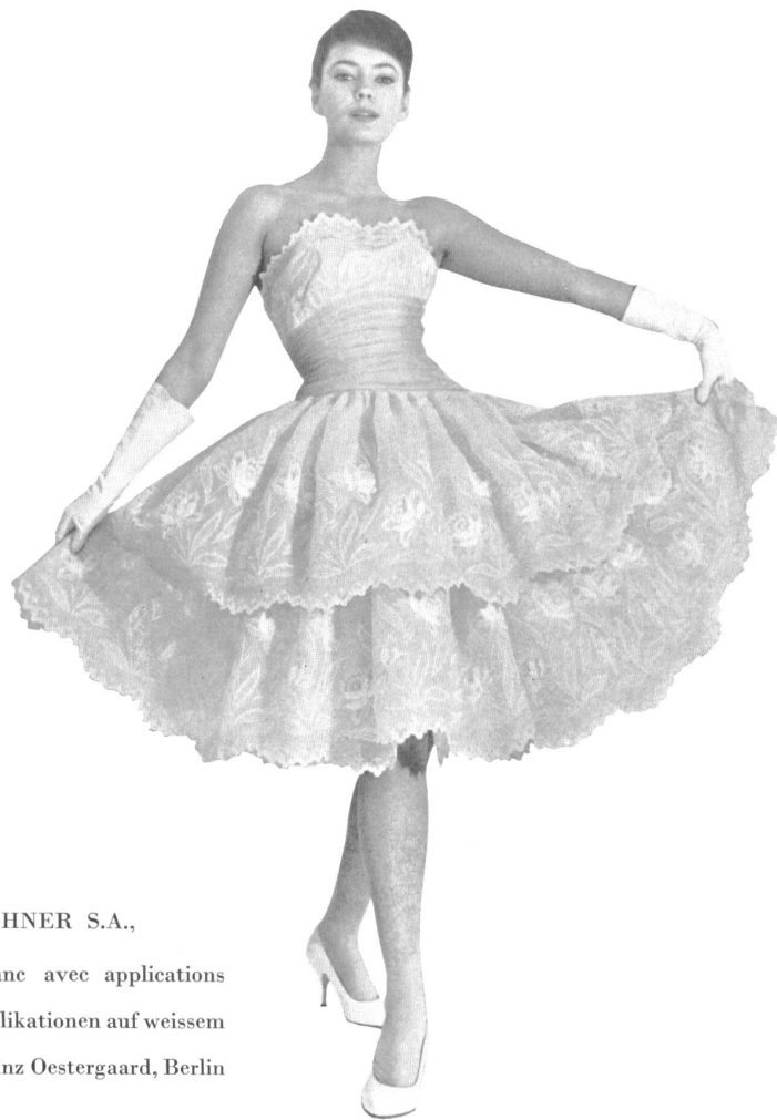
JACOB ROHNER S.A., REBSTEIN