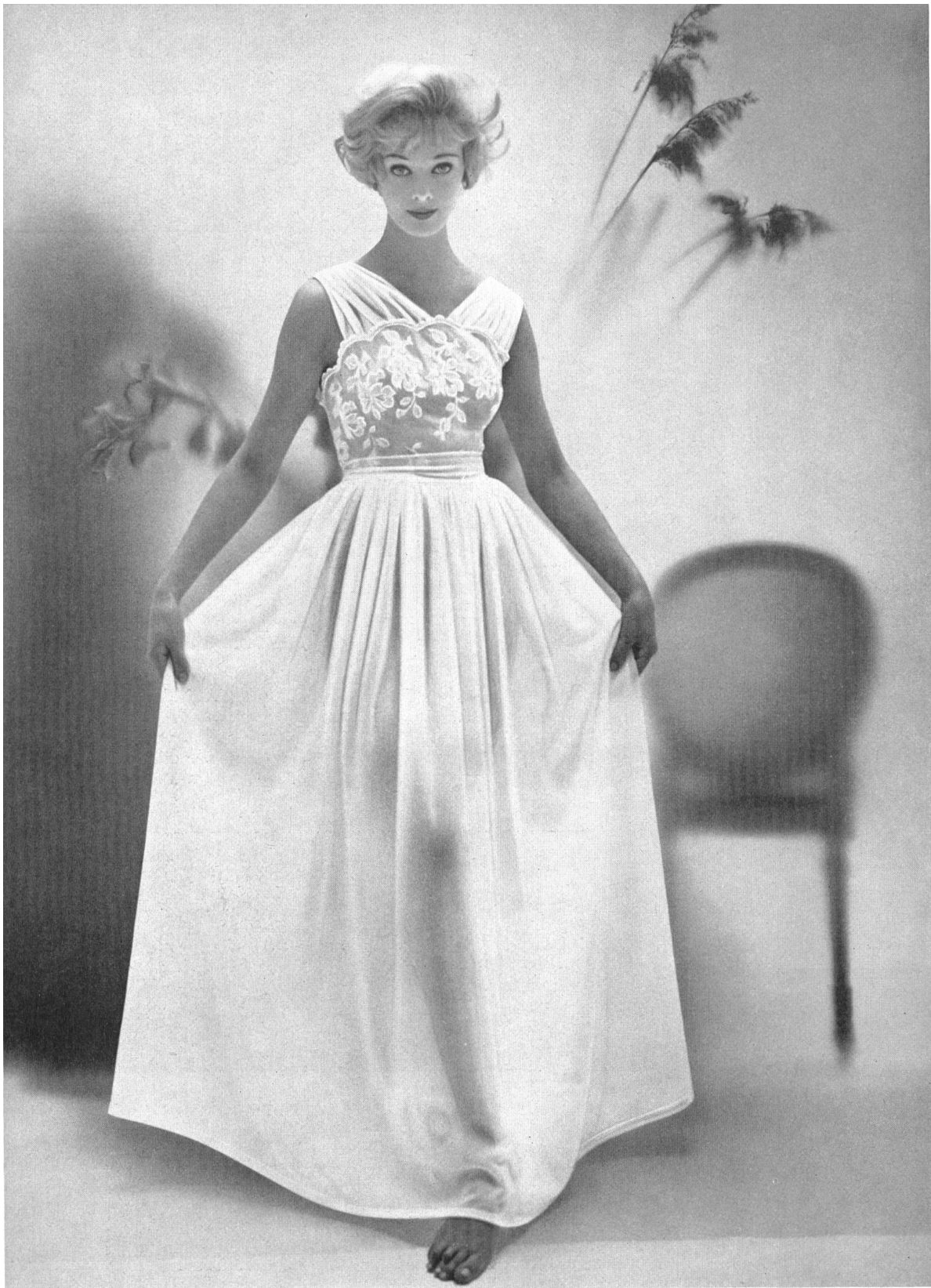
BISCHOFF TEXTIL A.G., ST. GALLEN Stickereien - Broderies. Nachthemd von : / Chemise de nuit de : Helfferich A.G., Neustadt (Deutschland).