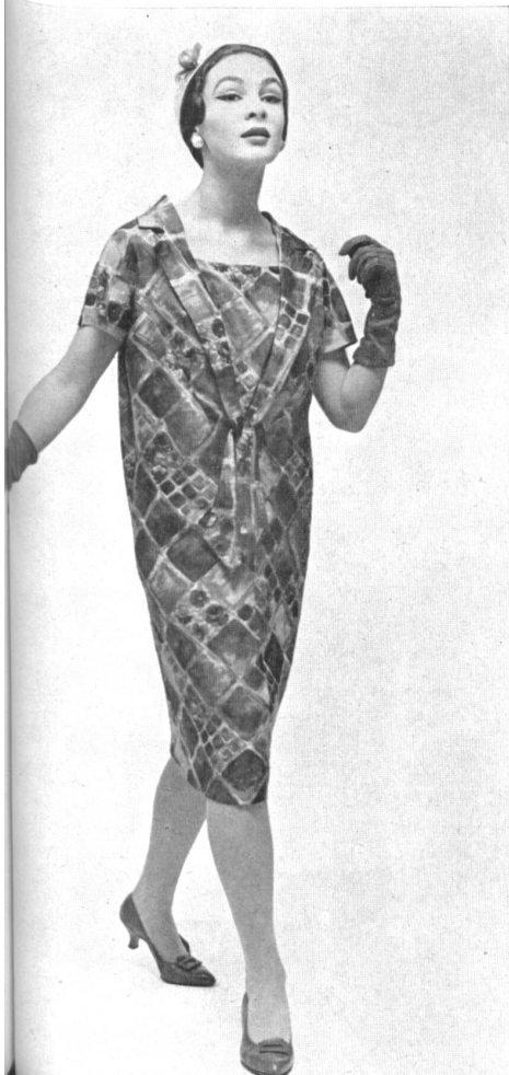
RUDOLF BRAUCHBAR & Cie A.G., ZURICH Caruca, printed pure silk fabric. Model E. Lucas & Co. Pty. Ltd., Melbourne.