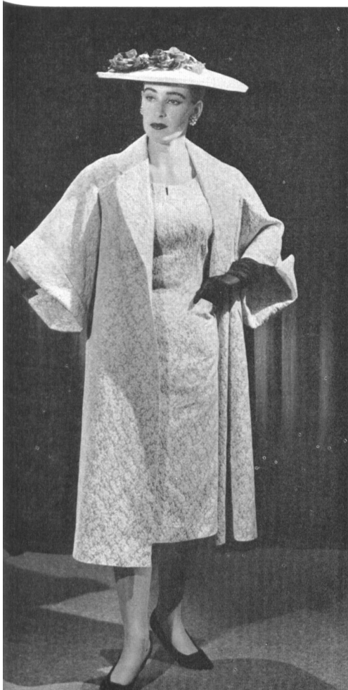
SILK MILLS NAEF BROTHERS Ltd., ZURICH Figured Crylor. Model Camcraft Ltd., Auckland (N.Z.).