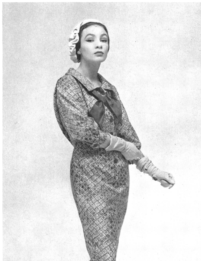
RUDOLF BRAUCHBAR & Cie A.G., ZURICH Bahia, printed pure silk fabric. Model E. Lucas & Co. Pty. Ltd., Melbourne