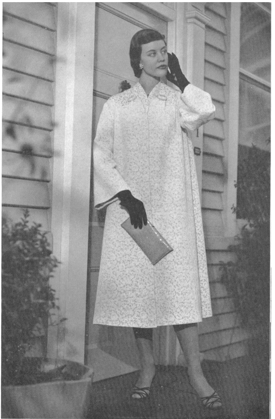
SILK MILLS NAEF BROTHERS Ltd., ZURICH Crylor Carla. Model W. Selby & Co., Christ- church (N.Z.).