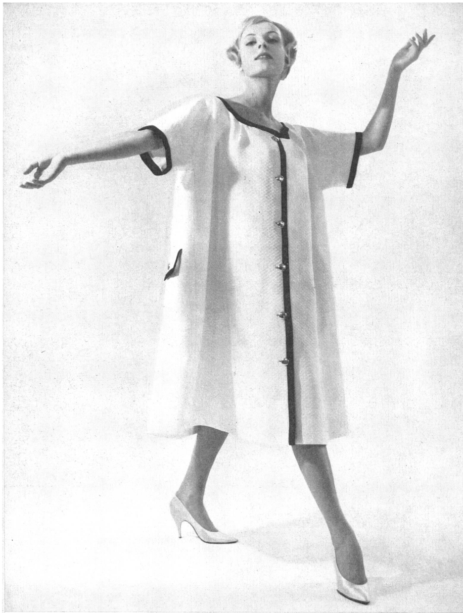
REICHENBACH & Co., SAINT-GALL Piqué. Modell: Heinz Oestergaard, Berlin.