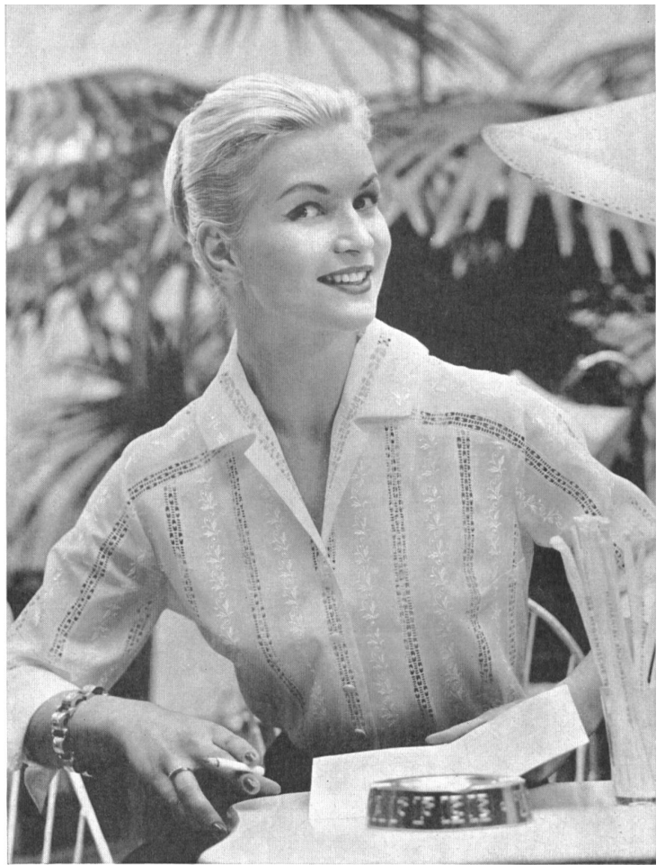
REICHENBACH & Co., SAINT-GALL Batiste brodée « Minicare ». Batist bestickt « Minicare ». Modell : Rositta, Wien.