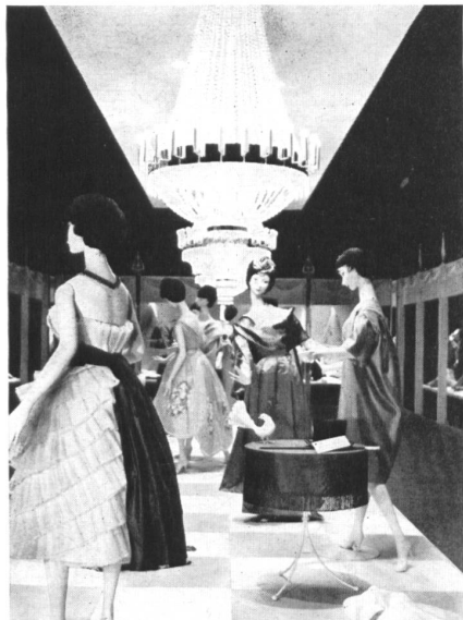
In der Ausstellung „Madame-Monsieur“.

Da das „Trikotzentrum“ letztes Jahr grossen Erfolg hatte, entschlossen sich die Aussteller, es in der gleichen Form wieder aufzunehmen, indem sie verschiedene Maschenprodukte unter einem bestimmten Thema gruppieren, und diese mit Einzelständen abwechseln lassen, das Ganze jedoch nach einer einheitlichen Idee gestaltet. Dem Besucher wird so die Möglichkeit geboten, sich ein ziemlich vollständiges Bild von den Produkten der Schweizer Maschenindustrie zu machen.