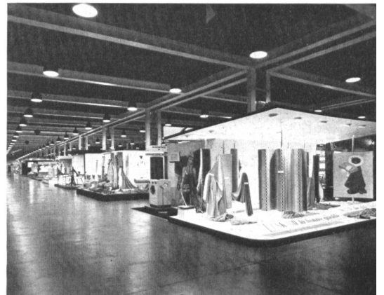
In den Textilhallen.

Der Exportverband der schweizerischen Bekleidungsindustrie hat eine gemeinsame Halle „Madame et Monsieur“, in der Kleidungsstücke für Damen und Herren aus den verschiedensten Geweben sowie Maschenprodukte, Wäsche, Strümpfe, Hüte, u. s. w. ausgestellt werden. Unter dem Titel: „Die Mode, ein Beruf für mich?“ wird dieses Jahr noch besonders auf die verschiedenartigen Berufsmöglichkeiten hingewiesen, um junge Kräfte heranzuziehen. Hier werden die einzelnen Zweige des Modeschaffens in anschaulichen Figurinen-gruppen dargestellt. Die Gestaltung dieser Schau wurde dem zürcher Grafiker Hans Looser übertragen.