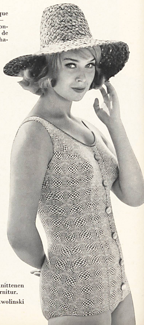
LAHCO S.A., BADEN Maillot de bain tricoté en «Hélanca» avec bretelles coupées dans le tissu et garniture de boutons. — Helanca knitted swimsuit with button trim. — Bañador de tela de punto «Helanca», con tirantes cortados en la misma tela y con garnición de botones. — Badeanzug aus gestricktem «Helanca» mit angeschnittenen Trägern und Knopfgarnitur.