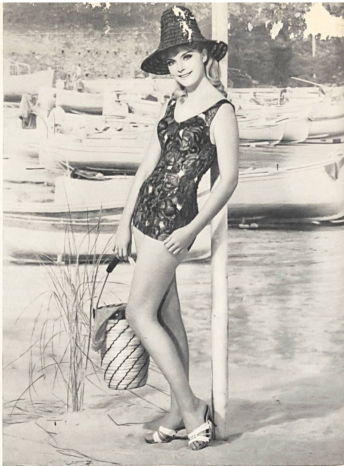
«ROBORO», J. F. ROHRER-BOLLIGER S.A., ROMANSHORN Maillot de bain en coton imprimé, épaulettes larges, profondément échancré dans le dos. — Printed cotton swimsuit, wide straps, deeply plunging back. — Bañador de algodón estampado, con hombreras anchas, muy escotado en la espalda. — Badeanzug aus bedrucktem Baumwollstoff, breite Träger, tiefer Rücken.