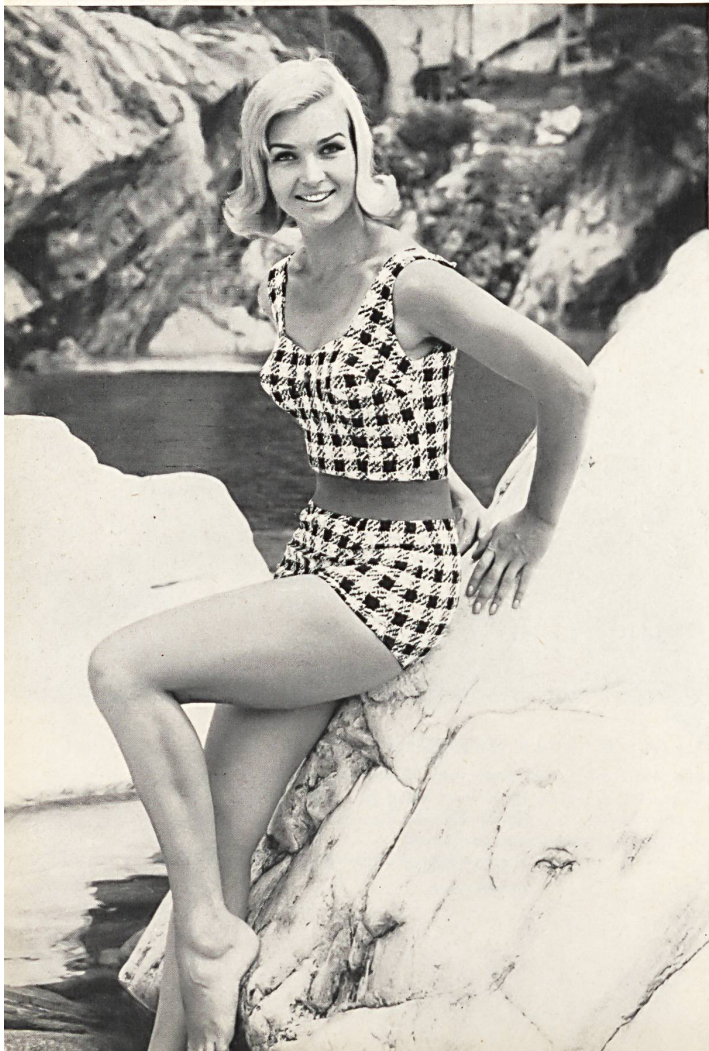
LAHCO S.A., BADEN Maillot de bain en tissu élastique avec ceinture contrastante. — Elasticized swimsuit with contrasting belt. — Traje de baño de tejido elástico con cinturón haciendo contraste. — Badeanzug aus elastischem Gewebe mit dazupassendem kontrastfarbigem Gürtel.