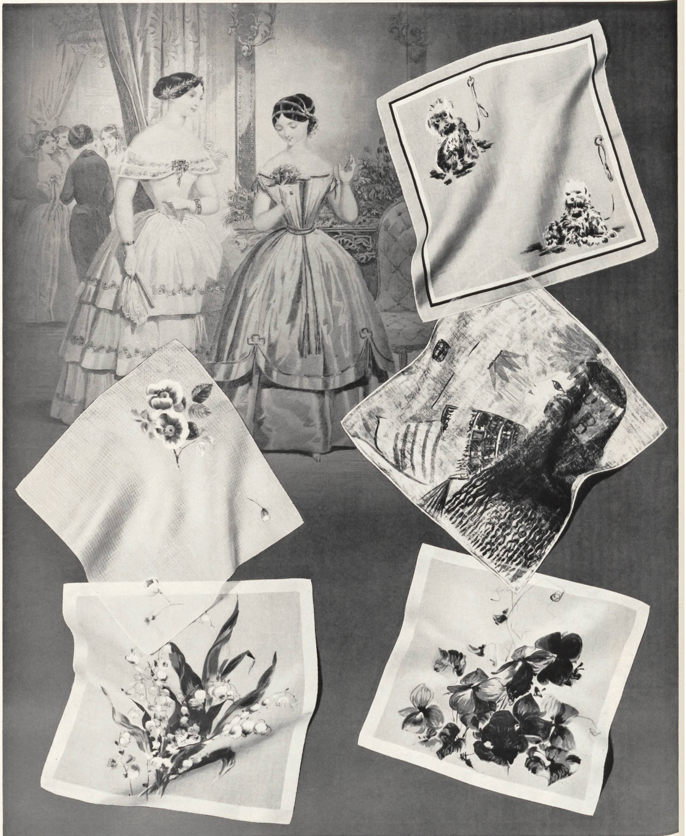
«NELO», J. G. NEF & CO. A.-G., HERISAU Mouchoirs «Nelo» imprimés, classiques et modernes. Printed «Nelo» handkerchiefs in classical and modern styles. Pañuelos «Nelo» estampados, clásicos y modernos. Bedruckte «Nelo»-Tüchli im klassischen und modernen Genre.