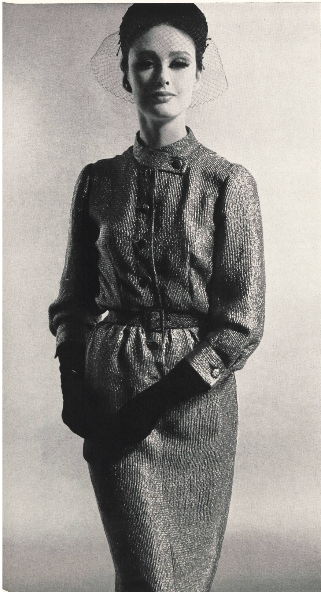
JACQUES HEIM Soie cloquée métal « Gitane » de L. Abraham & Cie, Soieries S. A., Zurich