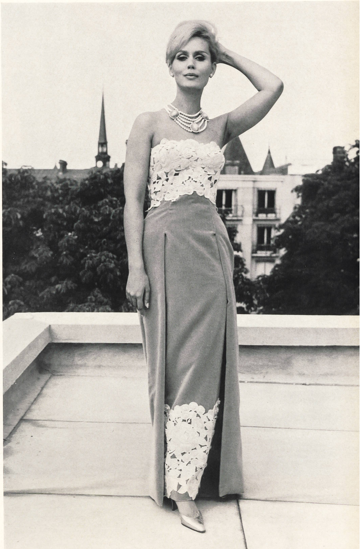
CARVEN Cuirpore imitation appliquée de Jacob Rohner S. A., Rebstein Grossiste à Paris: Robert Burg & Cie