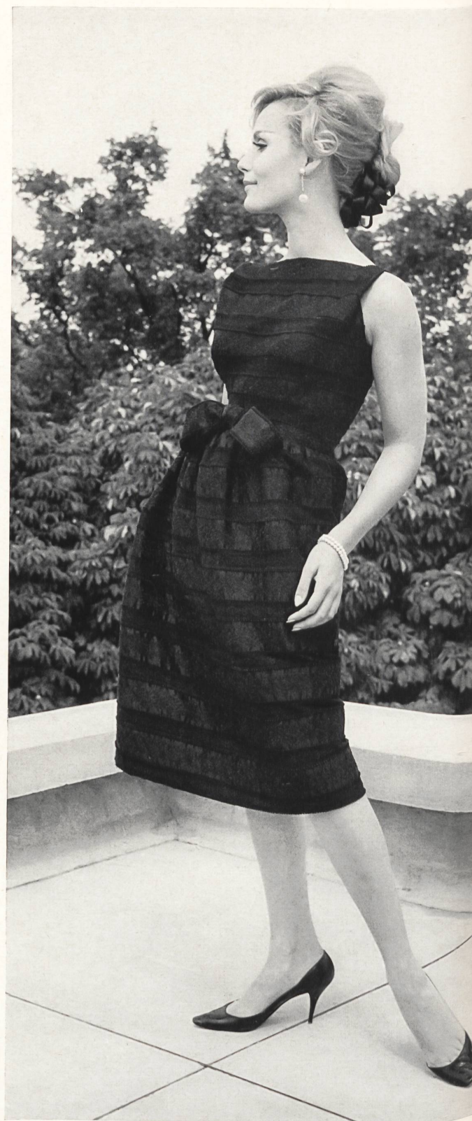
GUY LAROCHE Broderie « Nelo » sur satin de soie « Festival » de J.G. Nef & Co. S.A., Herisau Grossiste à Paris: Robert Burg & Cie