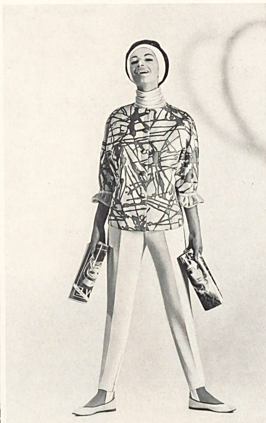
Reinseidenes Diagonal-Gewebe, bedruckt Modell Willy Roth