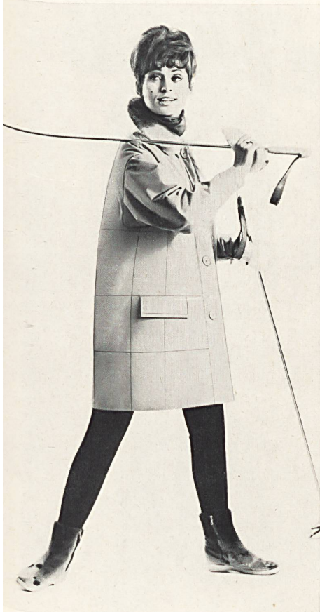
Washbares Ensemble aus «Skiflex Nylsuisse» qualité contrôlée; Gewebe von Schmid A.-G., handbedruckt von R. R. Wieland Kreation Willy Roth