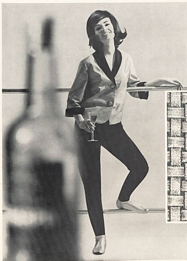
« ERESKO », ROBT. SCHWARZENBACH & CO. THALWIL

SWISS FASHION CLUB FREIZEIT - SPORT - LOISIR