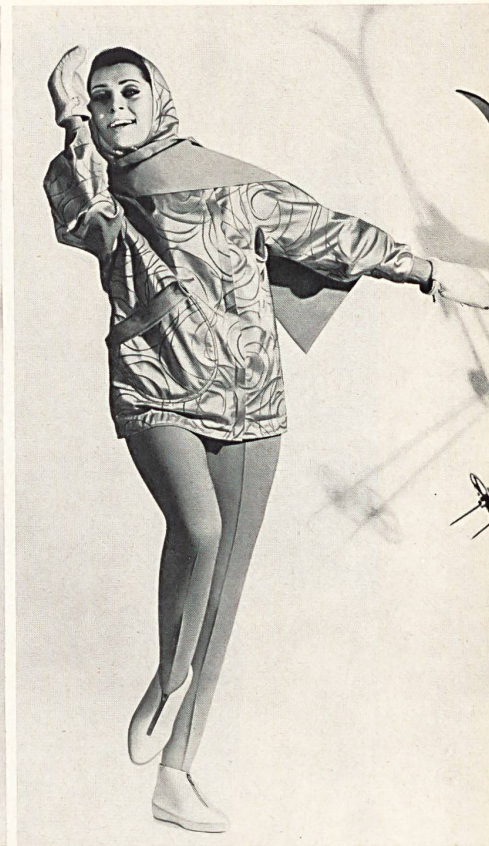
Jacquardgewebe aus Baumwolle/Rayonne in «Scotchgard»-Ausrüstung (Jacke) und elastisches « Helanca »-Gewebe (Hose) Modelle Willy Roth