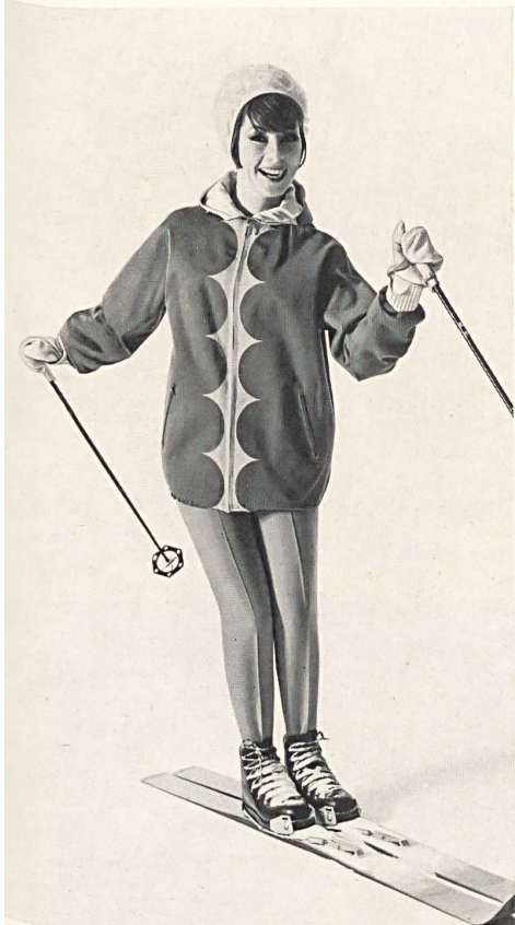
Jacquardgewebe aus Baumwolle/Viscose; elastisches Gewebe « Helanca »/Wolle (Hose) Modelle « Croydon », Respolco A.-G.