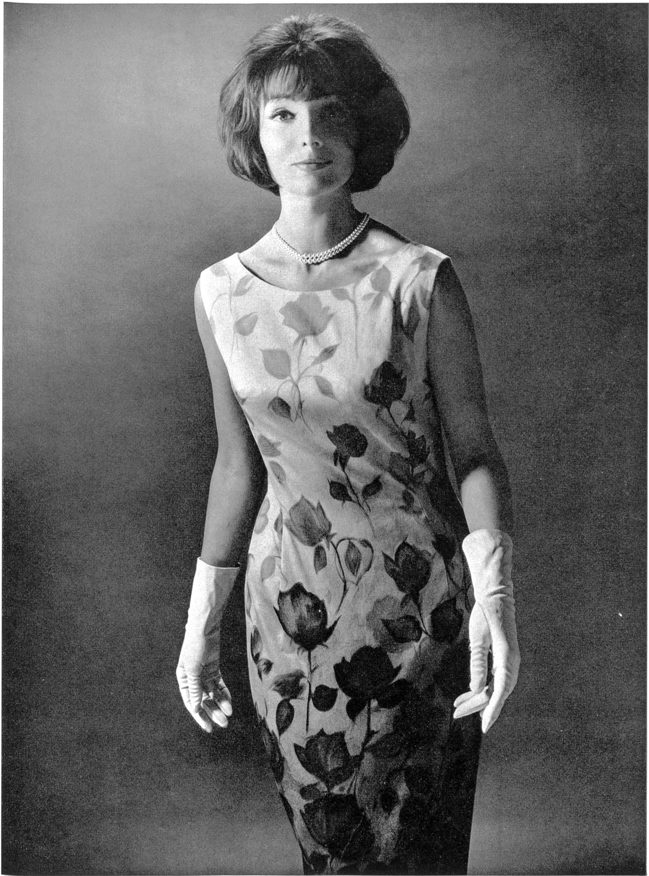
HEER & CIE S.A., THALWIL Panama de coton imprimé Printed basket weave cotton Panama de algodón estampado Baumwoll Panama, bedruckt Modèle R. Cafader & Co., Zurich