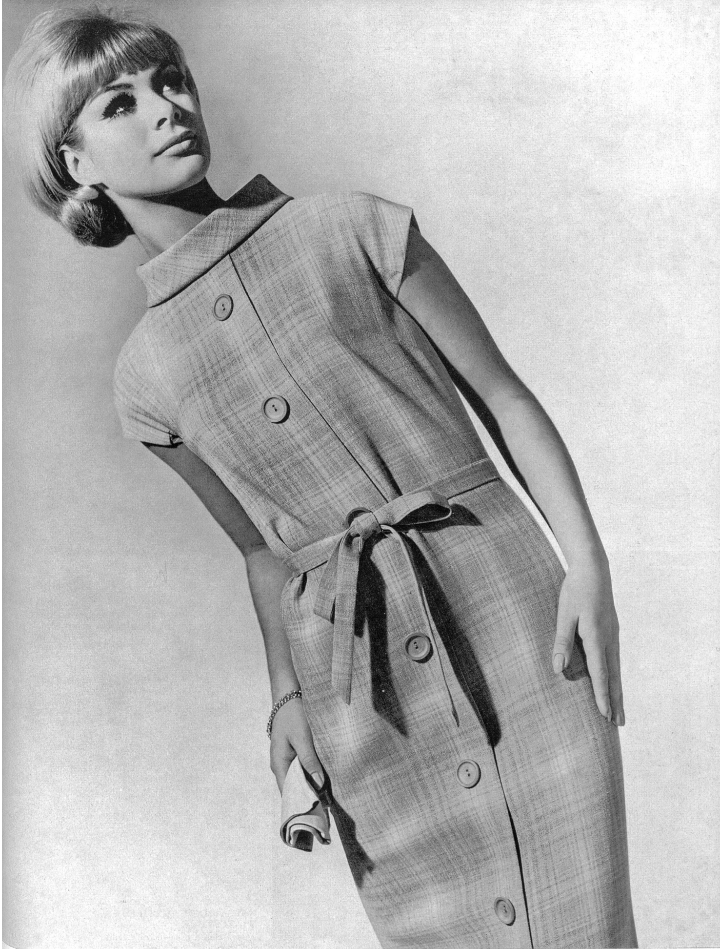
HEER & CIE S.A., THALWIL Tussana quadrillé, fibranne (staple-fibre / fibrana / Stapelfaser) Modèle Brüllmann & Co., Zurich