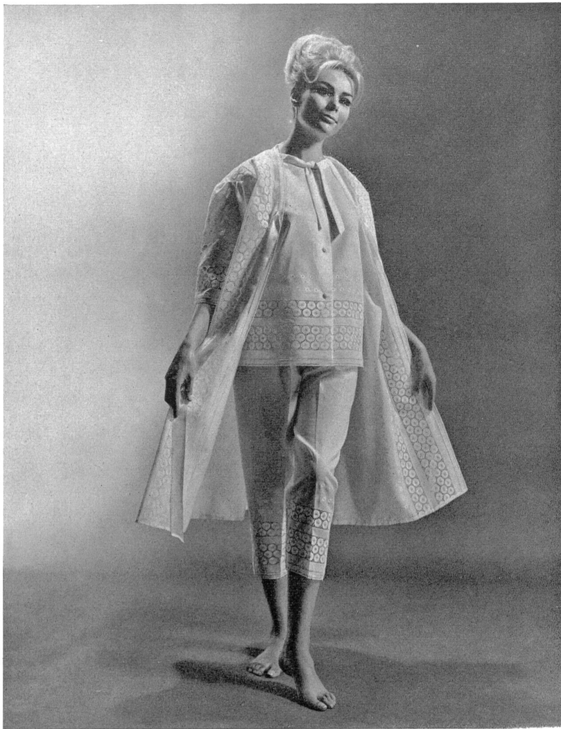
1 JACOB ROHNER S.A., REBSTEIN Batiste de coton « Minicare » brodée (embroidered cotton / algodón bordado / bestickte Baumwolle) Modèle Max Jablonsky, Zurich