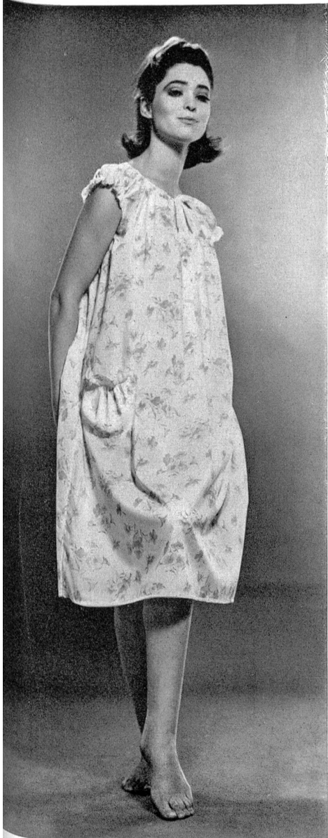
HAUSAMMANN TEXTILES S.A., WINTERTHUR « Hélanca » Diaphane « Minicare » imprimé (printed / estampado / bedrukt) Modèle Züst zur Rose, Rheineck « Minicare », Joseph Bancroft & Sons Co. A.G., Zurich