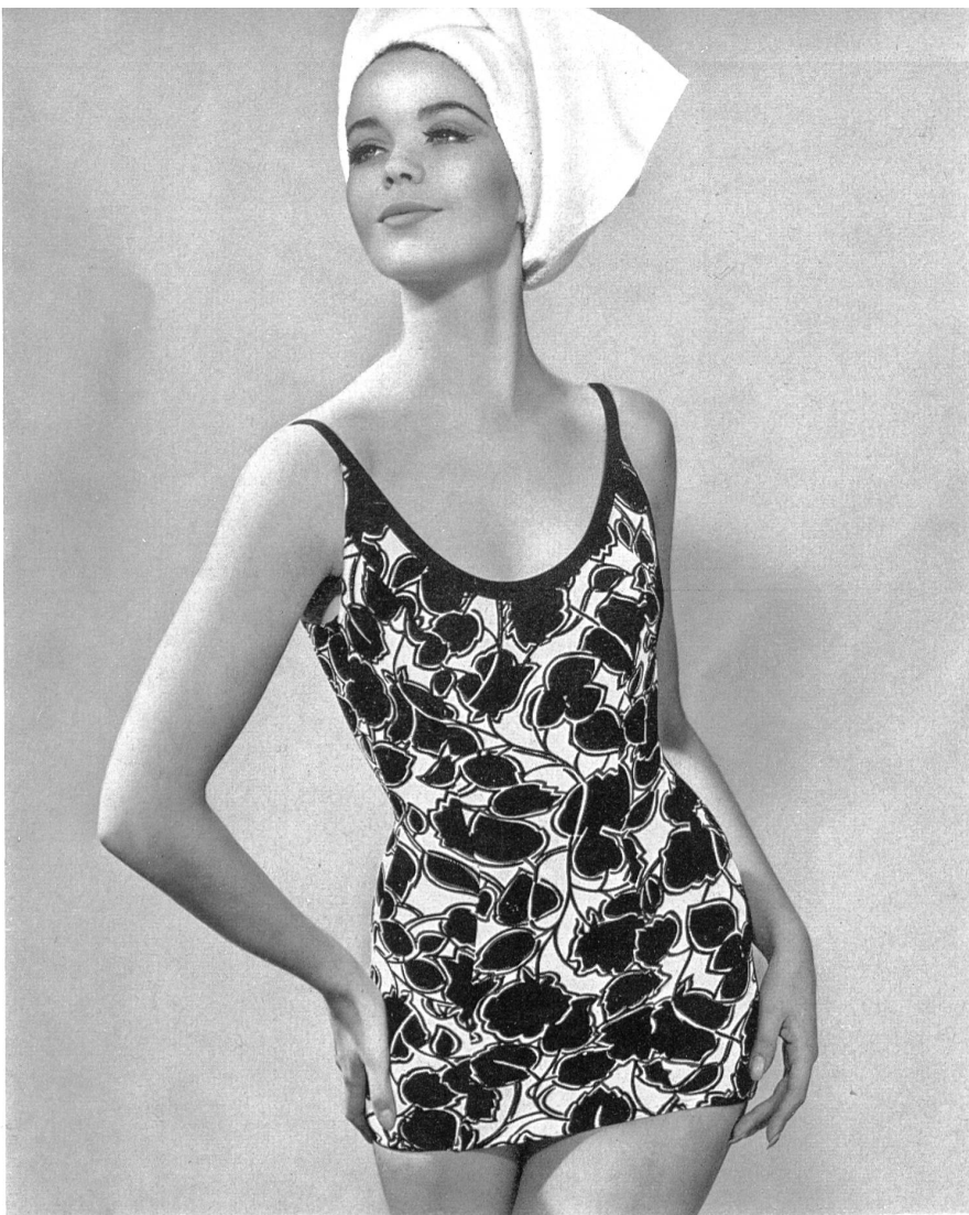
« ROBORO », J. F. ROHRER- BOLLIGER S.A., ROMANSHORN Maillot de bain en « Hélanca » imprimé Printed « Helanca » swimming suit Bañador estampado en « Helanca » Bedruckter « Helanca »-Badeanzug