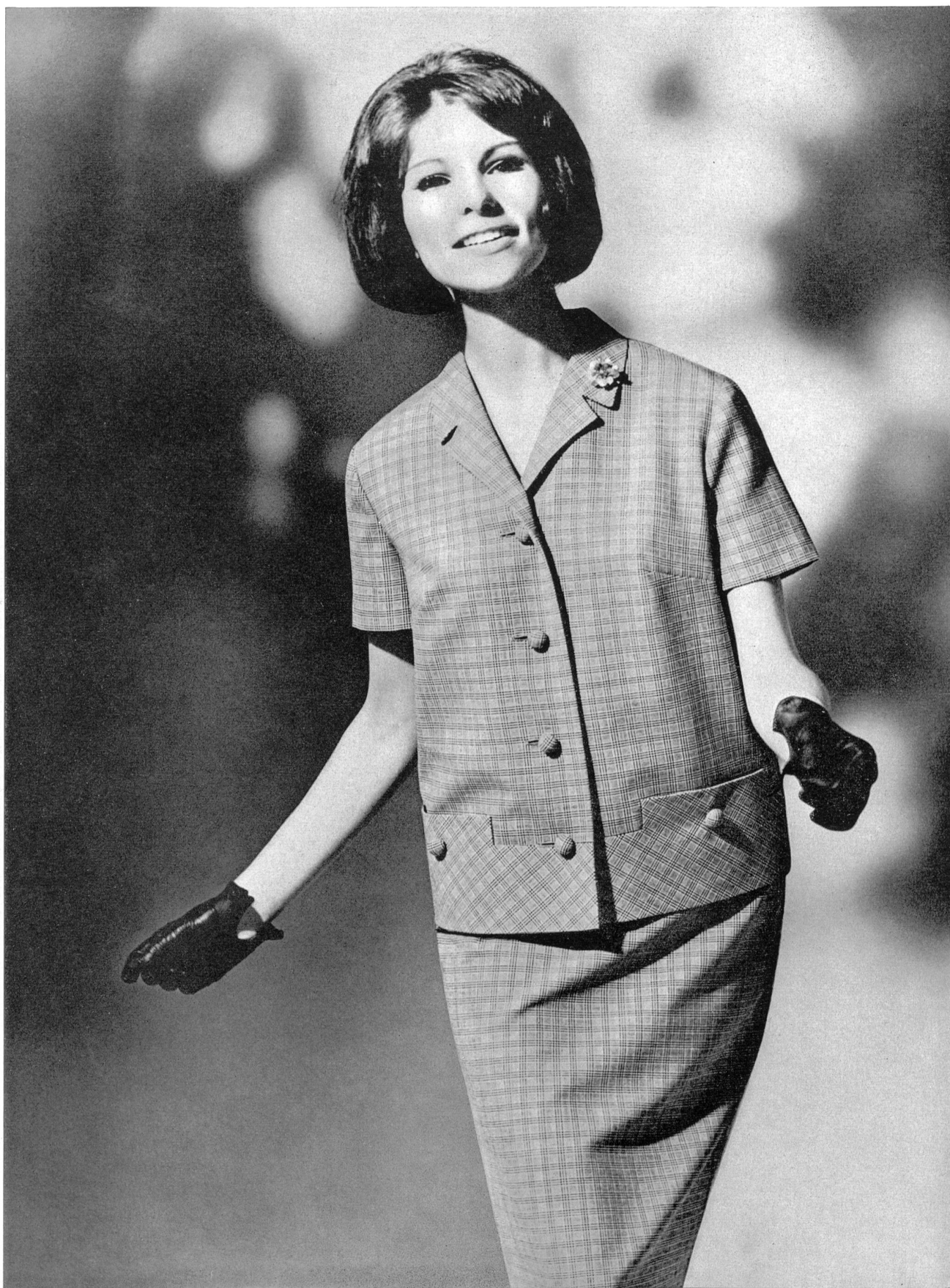
HEER & CIE S.A., THALWIL « Térylène » fantaisie (« Térylène »/laine - « Terylene »/wool - « Terylene »/lana - « Terylene »/Wolle) Modèle Paul Weibel A.G., Gossau