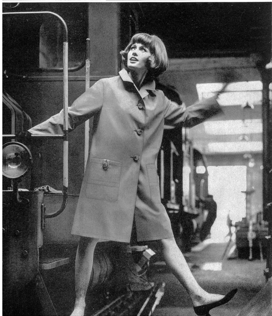
HAUSAMMANN TEXTILES S.A., WINTERTHUR « Osa-Atmic » tissu (fabric / tejido / Cewebe) (67 % Diolene / 33 % coton / cotton / algodón / Baumwolle) Modèle « Stroco », L. Stromeier & Cie, Kreuzlingen