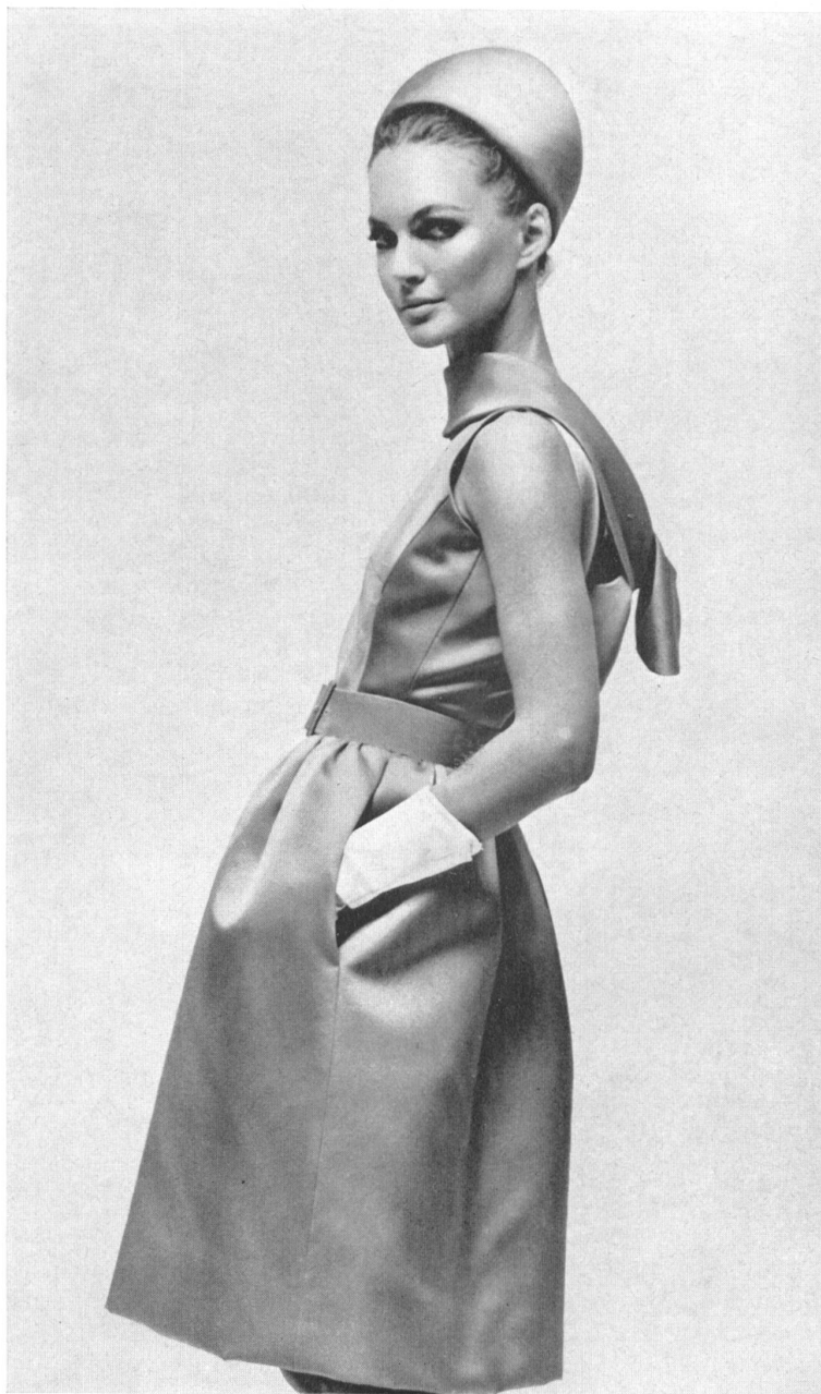
L. ABRAHAM & CO. SILKS LTD., ZURICH