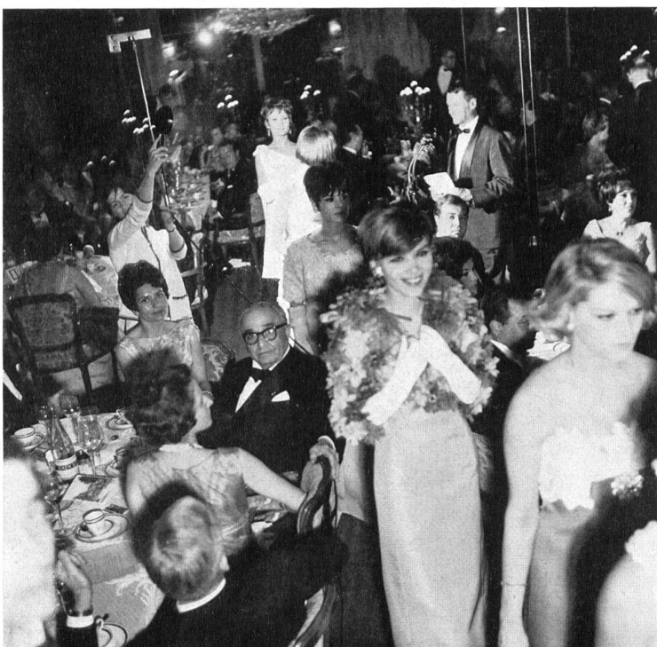
Das Finale der Modeschau anlässlich des Galadiners.

Ein vielseitiges und gut vorgetragenes Programm orientierte die Teilnehmer an den erwähnten Veranstaltungen über die verschiedenen schweizer Industriezweige, deren Mitwirkung sich die Schweizerische Handelskammer in Frankreich, die übrigens an dieser Stelle zum Erfolg ihrer Veranstaltungen beglückwünscht sei, zu versichern wusste.