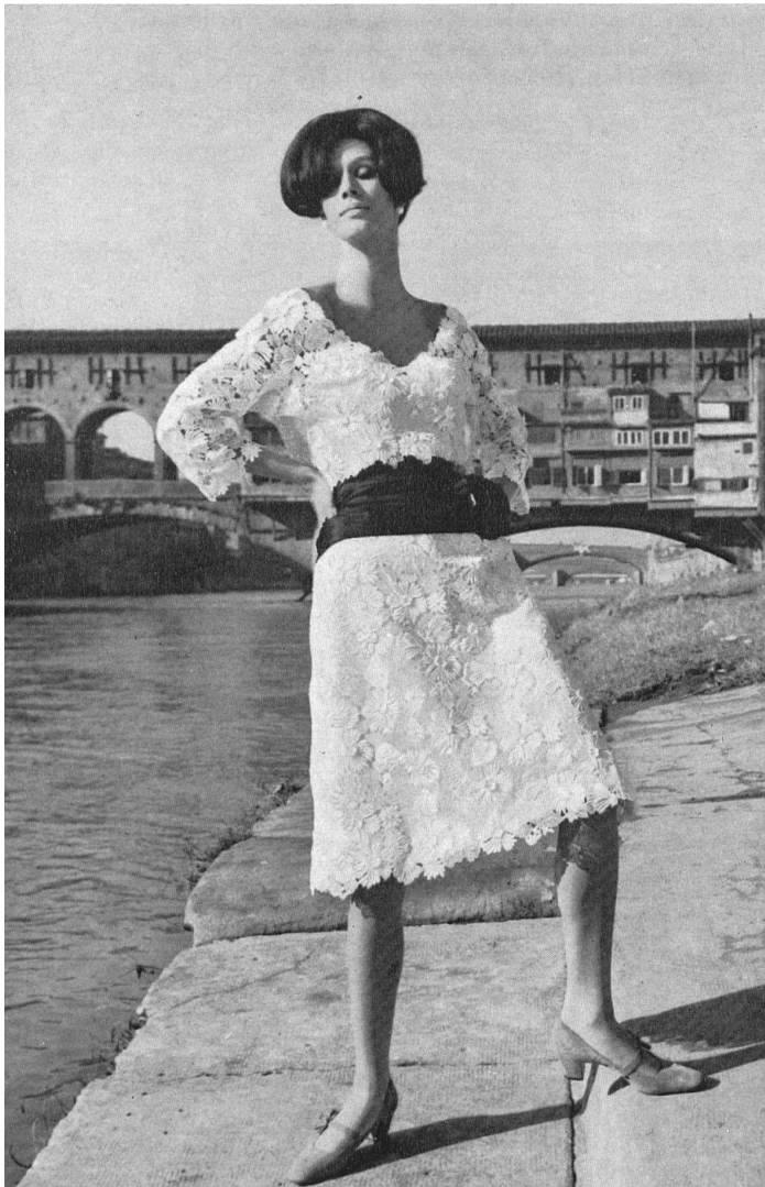
FORSTER WILLI & CO., SAINT-GALL Robe de cocktail en guipure Modèle Biki, Milan

Schweizer Organza konnte seinen letztjährigen modischen Erfolg behaupten. Forquet zum Beispiel, unter-