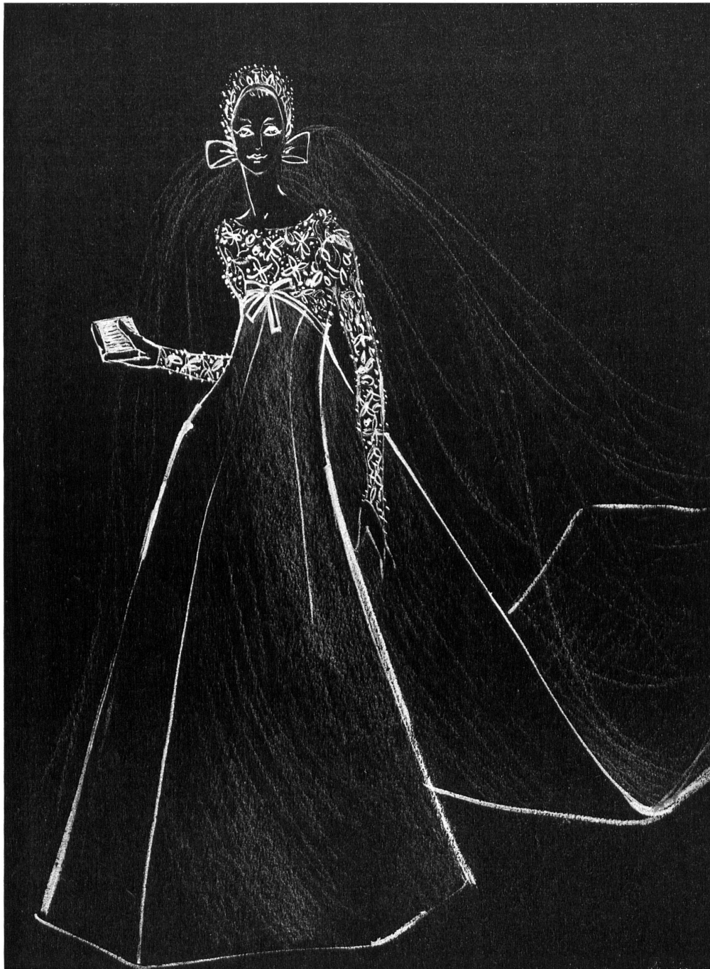
Magnifique robe de mariée; haut et manches avec appli- cations de broderies de: Superb wedding gown; top and sleeves with super- imposed applications of lace by: FORSTER WILLI & CO., SAINT-GALL Rahvis, London

Tartans und warme Pelzfutter liefert, weiss er auch mit seiner Zeit zu gehen und kommt der Nachfrage nach kleineren Preisen mit einer zweiten Couture-Kollektion entgegen, eine Spezialserie eleganter und praktischer Ensembles, die nur einer Anprobe bedürfen und eine Woche nach der Bestellung geliefert werden können. Sein kleiner Salon ist wie immer reich ausgestattet für den Herbst mit Kostümen in leuchtenden, dem Regen trotzen Farben und mit eleganten kleinen Kleidern für Cocktail und Dinner.