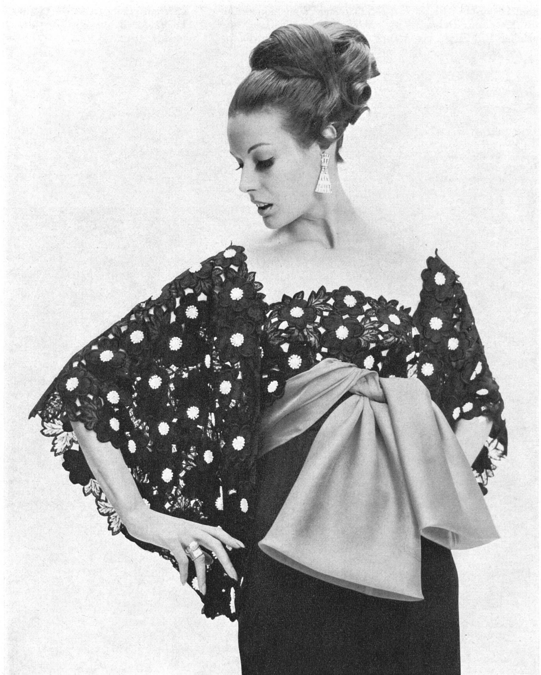
UNION LTD, SAINT-GALL Broderie découpée sur organza de soie noir Black cut-out lace of silk organza Modèle: Hardy Amies, Londres

schöpfer — sein, der es für seine reguläre Kollektion Herbst/Winter 1965 entworfen hat: es ist ein wunderbar schlankes Fourreau von einer trügerischen Einfachheit, aus einem Elfenbein-Gold Lamé von Abraham, das mit einem winzigen Turban aus dem gleichen Stoff mit einer Wolke von hauchfeinem blassgoldenen Tüll getragen wird.