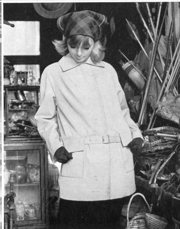
3 STOFFEL LTD., SAINT-GALL Tissu Aquaperl à finissage hydrofuge et antitaches Scotchgard Aquaperl fabric with Scotchgard rain and stain repeller finish Modèles: (à gauche / left) Heptex Ltd., Leeds (à droite / right) Cotsmoor Ltd., London