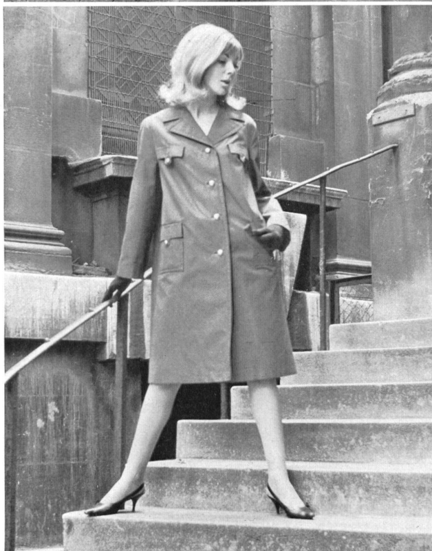
1 STOFFEL LTD., SAINT-GALL Tissu Aquaperl à finissage hydrofuge et antitaches Scotchgard Aquaperl fabric with Scotchgard rain and stain repeller finish Modèle: Morcosia