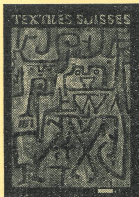
UNSER TITELBLATT Siehe Seite 117