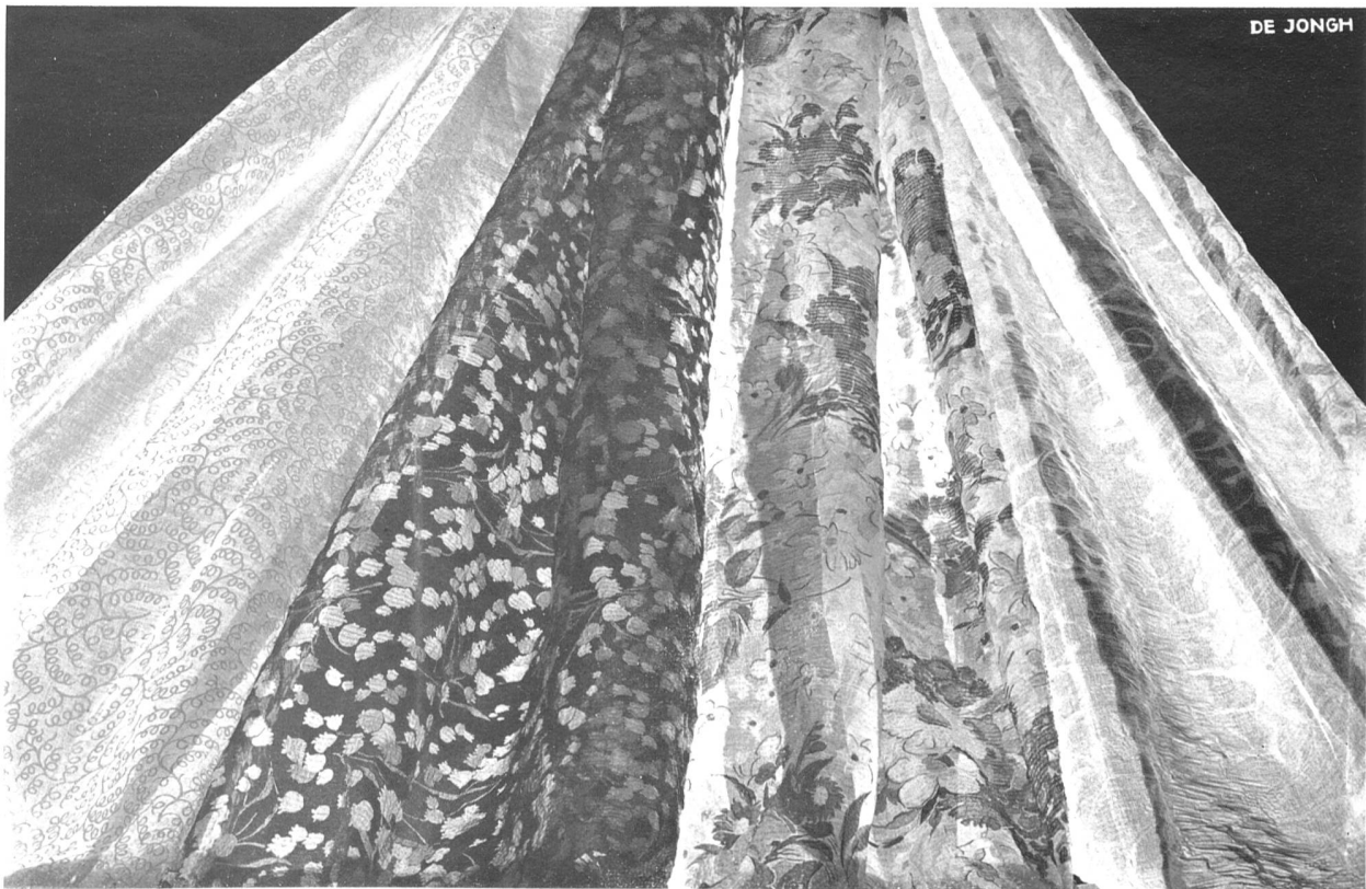
Tissus coton de Stoffel & Cie, St-Gall

Mais si je n'avais qu'un mot pour décrire ce qu'il y a de plus recherché aujourd'hui, je dirais : l'imprimé. Il y eut des imprimés chaque année, et les mousselines, les organdis, les percales de coton nous ont déjà été présentés sous cette forme. Mais il faut en parler spécialement maintenant, car ce qu'il y a de nouveau, ce sont les dessins. Ils sont si amusants ces dessins, si jeunes, si charmants. Tous les thèmes imaginables embellissent nos tissus de coton, en conservant cependant aux fleurs une place importante. On voit aussi des imprimés qui imitent la broderie ; d'autres sont très beaux avec leurs impressions or ou argent. L'ingéniosité des fabricants ne s'arrête pas là, et des organdis sont tissés avec un mélange de fils d'or et d'argent ; certains dessins découpés et appliqués sur le tulle pendant la fabrication sont encore un autre genre. On comprend notre enchantement devant les collections qui ont utilisé ces précieux auxiliaires.