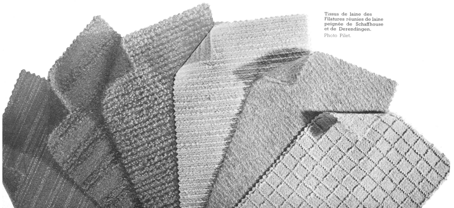
Tissus de laine des Filatures réunies de laine peignée de Schaffhouse et de Derendingen.

Pour étendre le domaine de la fantaisie dans la haute couture, les fabricants suisses ont employé toute leur ingéniosité à créer des nouveautés. C'est ainsi que la fabrication des laines à tricoter s'est considérablement développée, par la création de nouveaux mélanges, grâce aussi à de nouvelles machines.