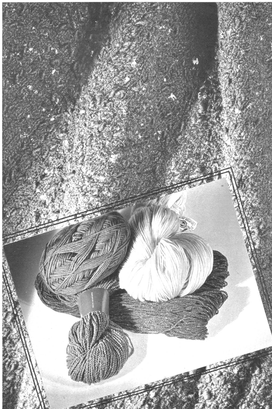
Les tricots travaillés à la main, avec les fils de laine de la Manufacture de laines H. E. C., Aarwangen.