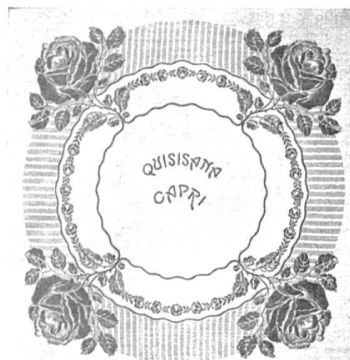
Lingerie d'hôtel avec inscriptions tissées. Modèles de Schmid & Cie. Tissage de toi- les, Berthoud.