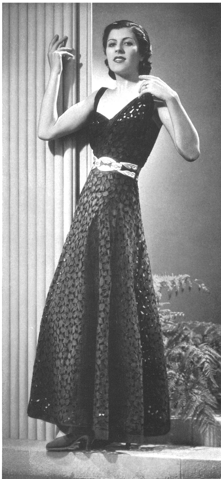
« Clairvoie » — Robe de dîner en broderie de St-Gall noire, ceinture de peau d'or et pierres de couleur. Modèle de Robert Piguet, Paris.