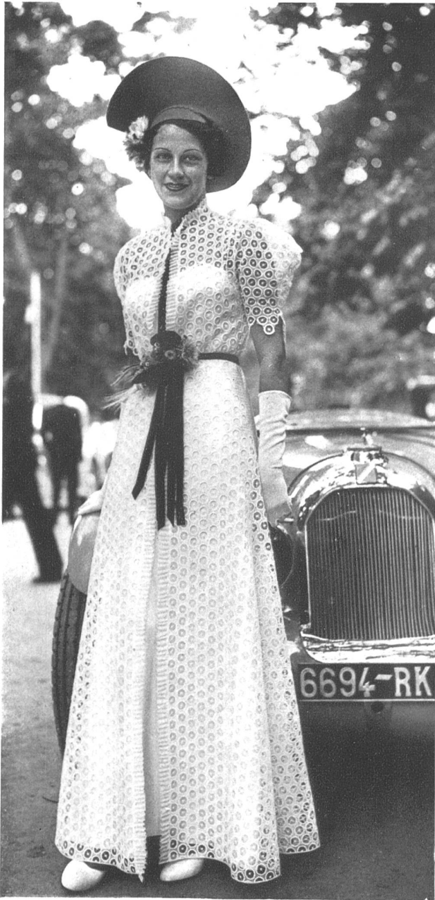
La broderie suisse dans la haute couture.

sur un fourreau étroit : parfois une jupe de dentelle s'oppose à un corselet de velours : plus souvent c'est aux hauts des robes que la dentelle apporte sa délicate transparence. Les couturiers marient parfois la dentelle et le tulle ; les ruchés, les volants ou les jupons de tulle dessinent l'ampleur de la jupe et font des robes aériennes et d'une grâce juvénile. Bien entendu, ces dentelles existent dans tous les coloris à la mode et la dentelle argentée a beaucoup de succès. La dentelle est tout indiquée pour les robes de dîners que l'on veut simples et élégantes ; un corsage de dentelle sur une jupe longue et étroite donne l'allure d'une robe du soir. Les robes d'après-midi et les blouses habillées sont bien souvent en dentelle. Les accessoires jouent aussi un rôle dans l'élégance féminine ; la femme peut aisément accroître son charme en portant un chapeau de dentelle, ombrageant harmonieusement son visage. Les gants en dentelle, les souliers et les sacs en dentelle sont autant d'atours dont la femme se pare dans son désir de plaire. La gaine élastique, légère et imperceptible, donnera à sa ligne la souplesse que nécessitent ses robes d'aujourd'hui.