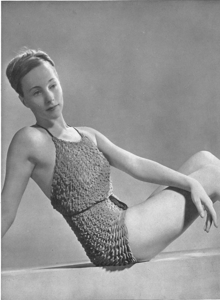
Costume de bain „Nahholz-Perfecta“ des Tricotages mécaniques Nahholz S. A., Schönenwerd.

L A SUISSE qui évoque pour tous l'idée des vacances, des sports et de la vie en plein air est toute désignée pour satisfaire, mieux que n'importe quel autre pays, aux besoins nouveaux que crée cette fièvre de voyage qui s'est emparée de toutes les classes de la société. Elle est à même de se rendre compte des efforts qu'il est indispensable d'accomplir pour fabriquer des tissus chauds et légers, gardant leur netteté et leur impeccable tombant.