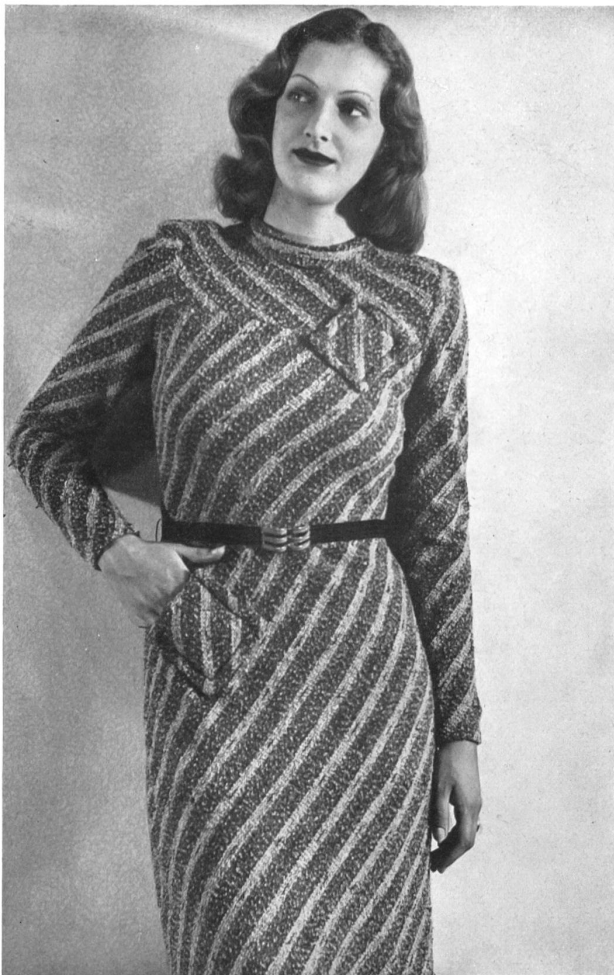
Modèle en jersey fantaisie de la Manufacture de Jersey Yvel, Zurich.

Tailleur „Heimswaters“ de S. Heim Fils S. A., Baden.