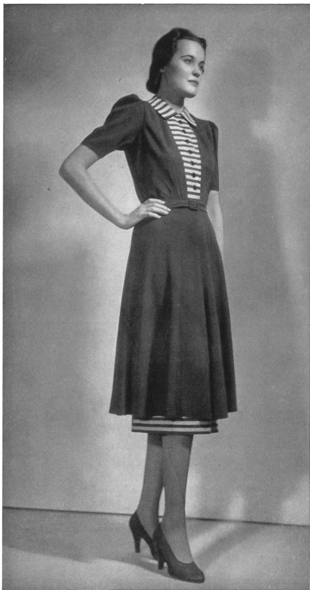
Modèle Algo, Zurich.

Il s'agissait des premières collections du printemps, établies sur la base des derniers modèles de Paris, dont on a pris les idées les plus heureuses pour les compléter par quelques créations particulières à l'industrie suisse. On peut dire, d'une façon générale, que les fabricants suisses se sont donné beaucoup de peine pour créer des modèles habillés et que leur production a pris un essor considérable.