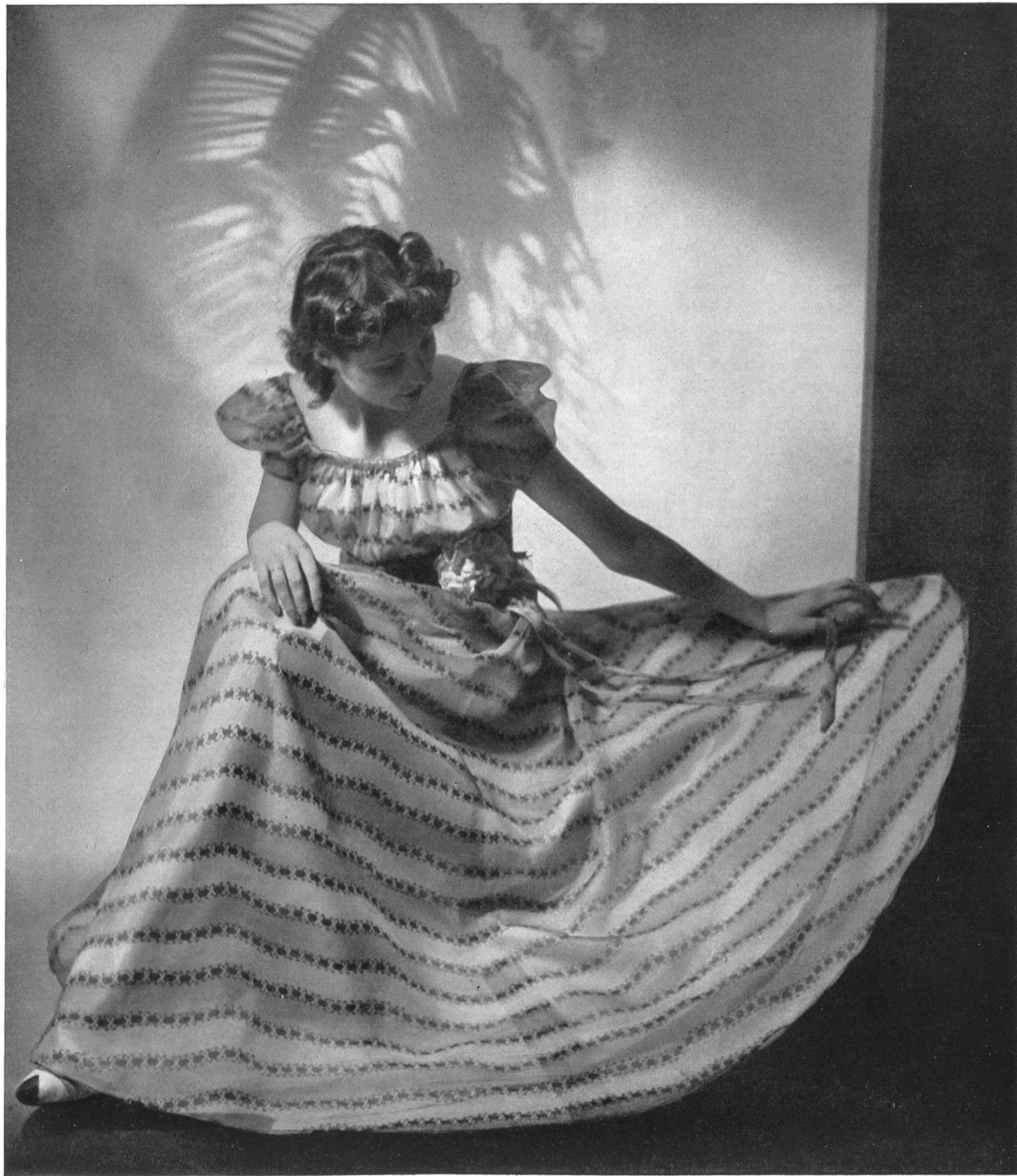
Modèle Willy Meyer, Zurich.

Voici maintenant les robes du soir. Elles sont longues, amples, la partie supérieure collante. Et ensuite les manteaux de dames à la fabrication desquels se consacrent plusieurs maisons suisses qui méritent également une mention. Pour le printemps, on prépare des manteaux de laine légers, en tissus souples. Ces manteaux sont souvent sans col, parfois même sans revers ou avec des revers très courts.