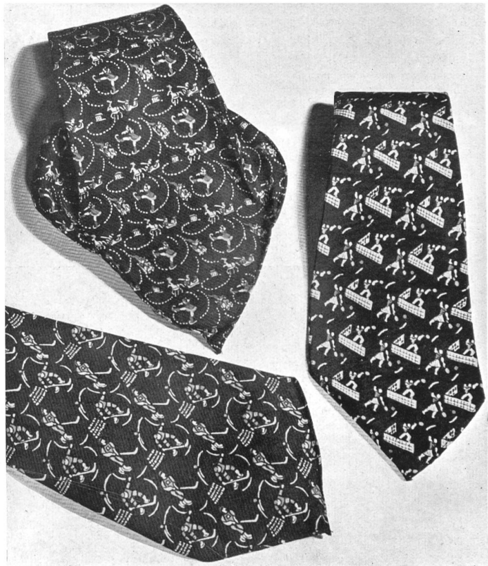
Cravates de soie avec motifs sportifs. Création de E. Vonwiller, Zurich.