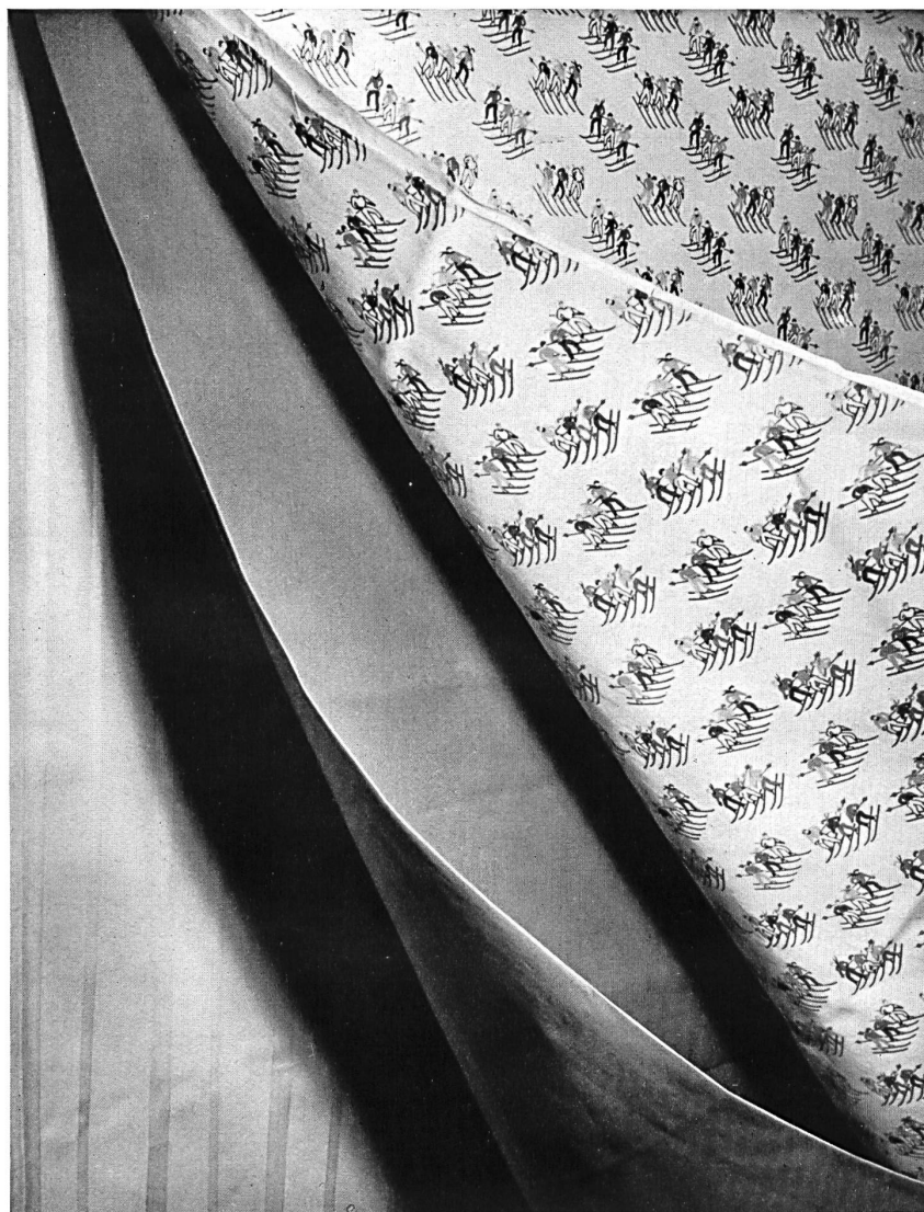
Popelines imprimées et imprégnées de Winzeler, Ott & Cie S. A., Weinfelden.

Pour la confection des blouses de ski, par exemple, les popelines tendent à remplacer complètement les étoffes de laine plus lourdes. Ce sont des tissus serrés et lisses offrant un maximum d'imper-