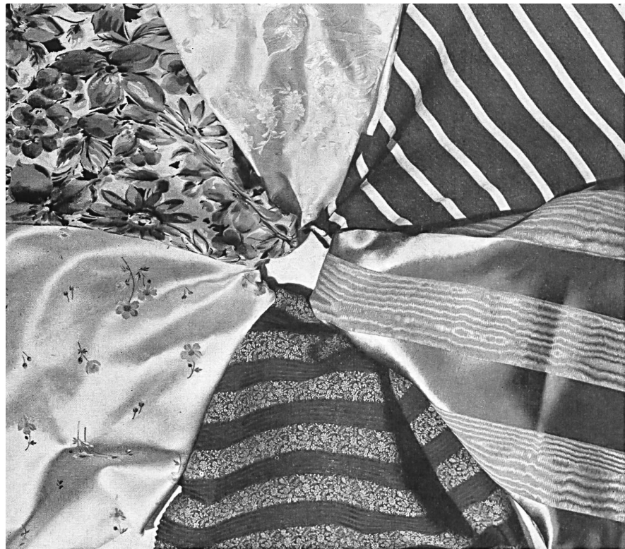
Tissus pour robes fournis par l'Association des fabricants suisses de tissus de soie, Zurich.

La production de l'industrie suisse de la soie est, en effet, extrêmement étendue et les milliers de nouveaux modèles ont trouvé l'approbation de la clientèle des plus grands centres mondiaux de la Haute Couture. Toutes les soies, de la plus simple doublure au brocart le plus riche, sont tissées en Suisse. Qu'il s'agisse de soie ou de rayonne, on trouve dans ce pays les genres