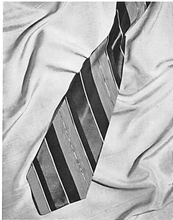
Cravate de la maison W. Haus & Co., Zurich.

Les industriels suisses de la soie, s'inspirant des maîtres de la couture renouvellent inlassablement leurs créations et s'adaptent merveilleusement aux exigences si changeantes et si autoritaires de la mode. Malgré la concurrence des grands pays la Suisse, dans ce domaine, s'impose, grâce à la perfection de ses articles et de leur valeur commerciale.