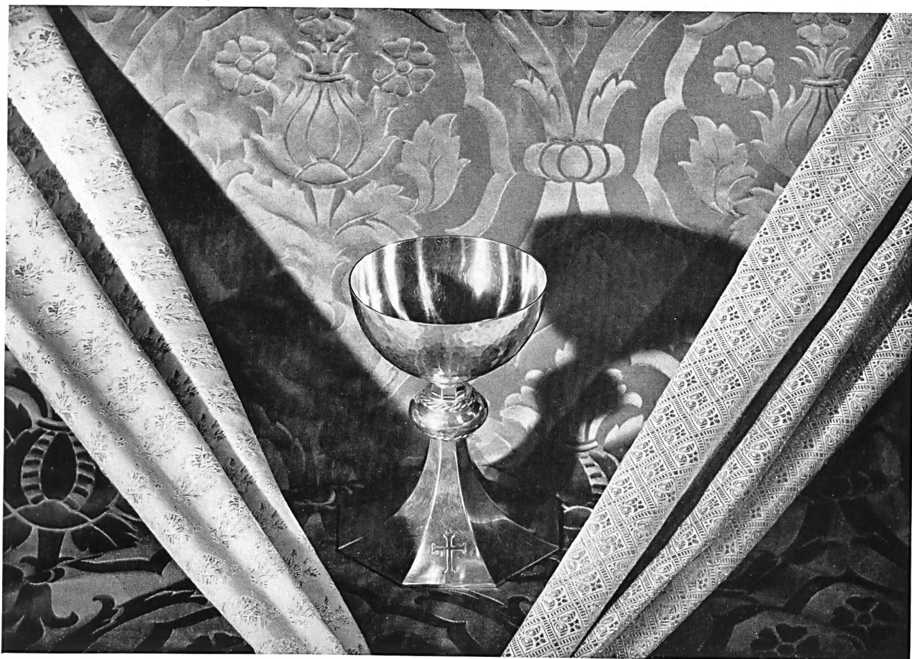
Tissus sacerdotaux fournis par l'Association des fabricants suisses de tissus de soie, Zurich.

C'est depuis plusieurs générations que les soieries de Zurich sont introduites et se maintiennent sur les marchés mondiaux. Leur position y est assurée, malgré la concurrence, grâce aux spécialités renommées de l'industrie suisse. En effet, une technique très poussée et l'expérience d'une longue pratique permettent aux fabricants suisses de produire, à côté des étoffes classiques et courantes, des tissus spéciaux difficiles à obtenir ailleurs.