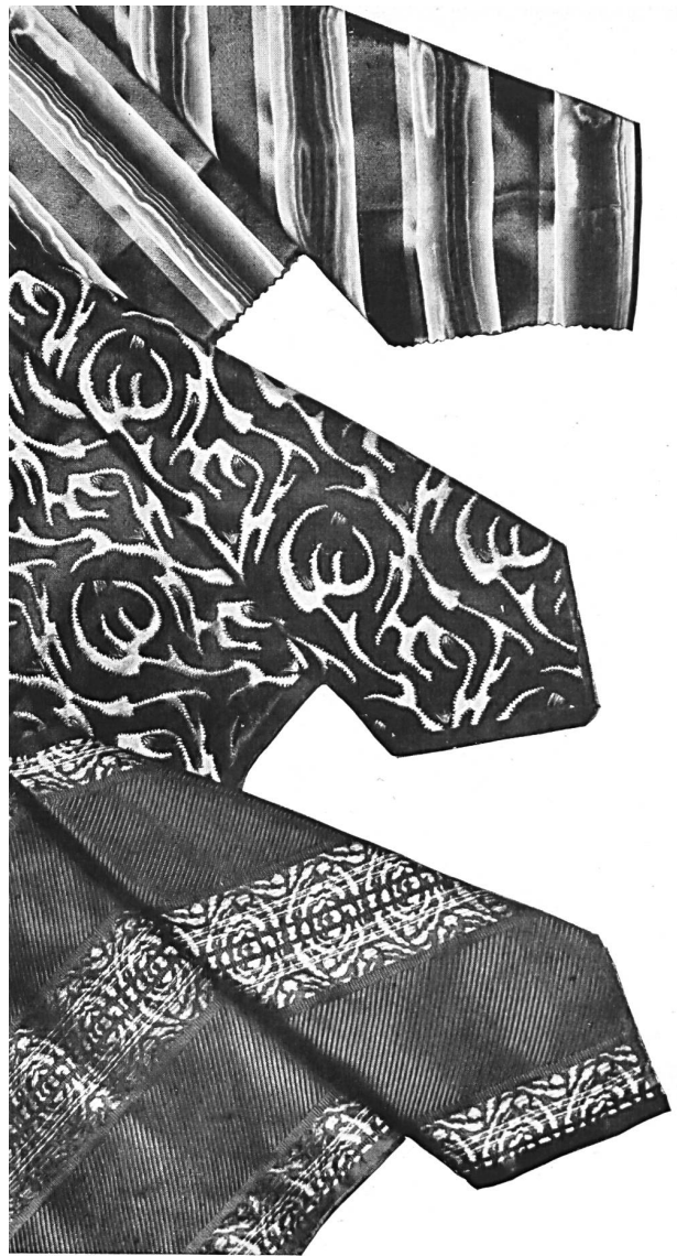
Tissus pour cravates de la maison Siber & Wehrli S.A., Zurich.