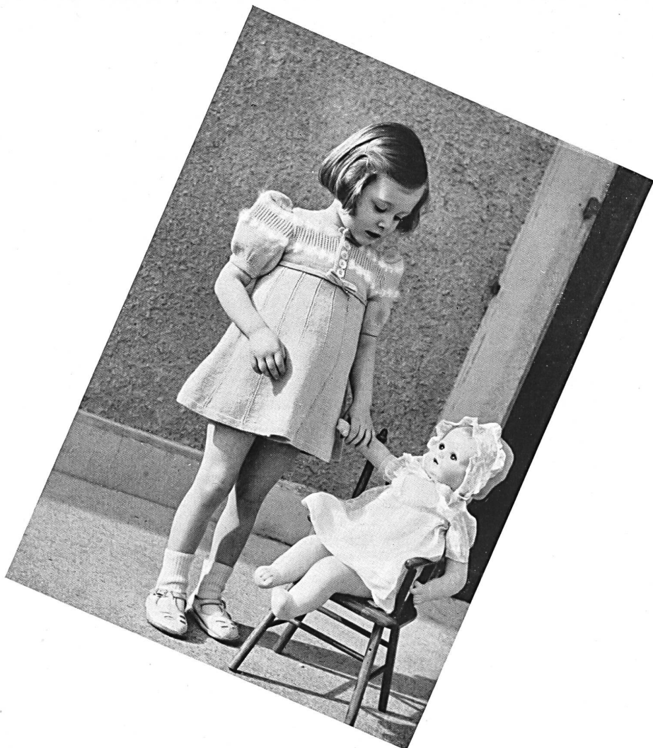
Créations de Geiser & Cie S. A., Huttwil.