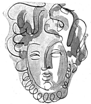
Modell Modèle Sauvage Couture

« Crêpe faille » rot aus Kunstseide mit Zellwolle :