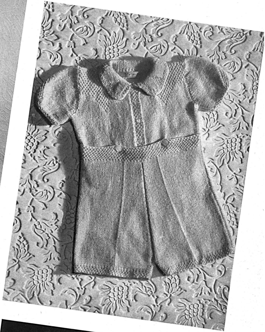
Geiser A.-G., Huttwil. Gestrickte Kinderkleider aus «HELANCA»-Garn, neuer Ersatz für Wolle. Vêtements pour enfants, tricotés en fil «HELANCA», matière nouvelle remplaçant la laine.