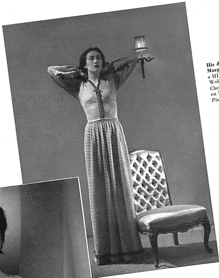
His & Co. A.-G., Murgenthal. « HISCO » Nachthemd aus Wollmischung. Chemise de nuit « HISCO » en laine mixte.