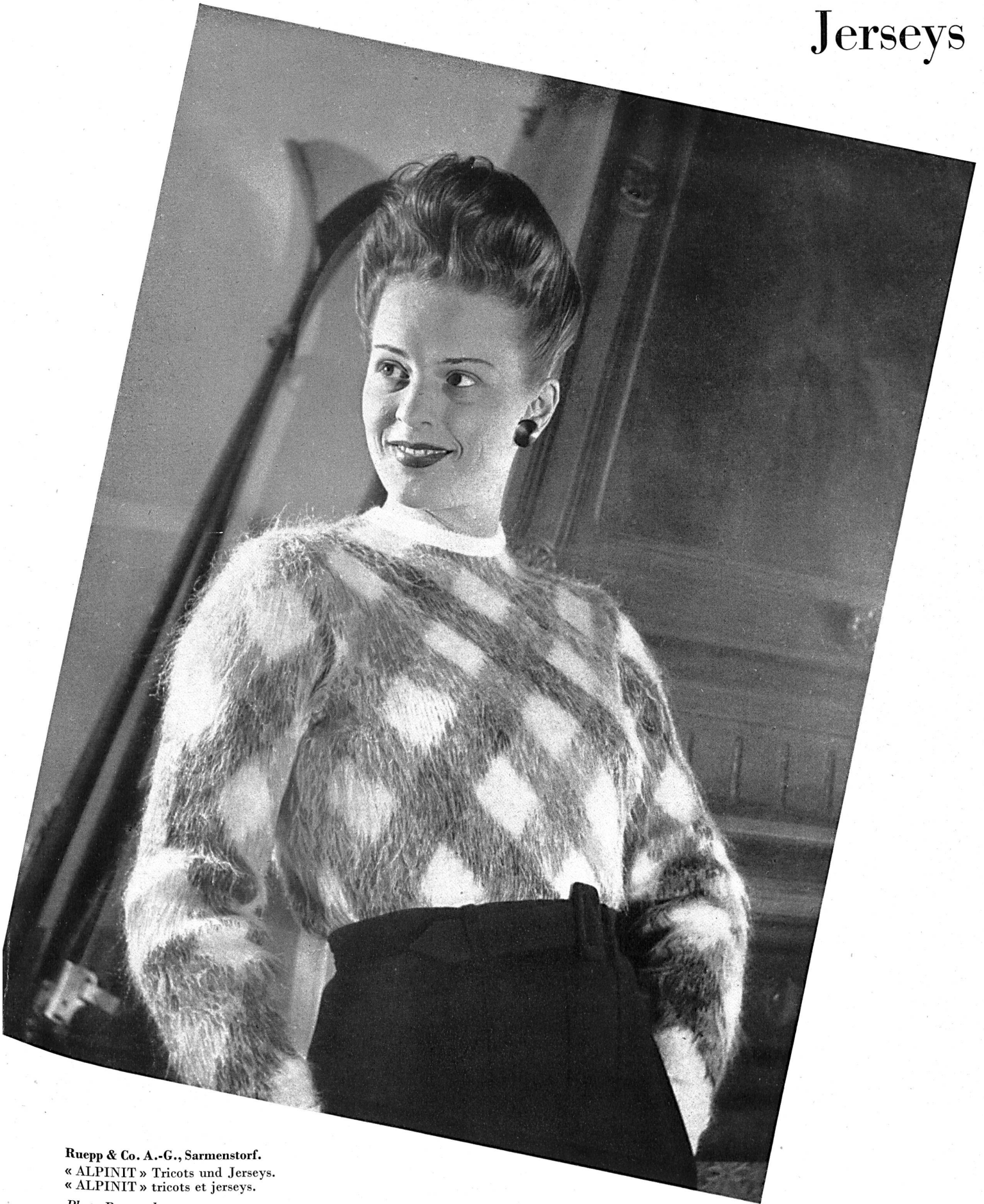
Ruepp & Co. A.-G., Sarmenstorf. « ALPINIT » Tricots und Jerseys. « ALPINIT » tricots et jerseys.