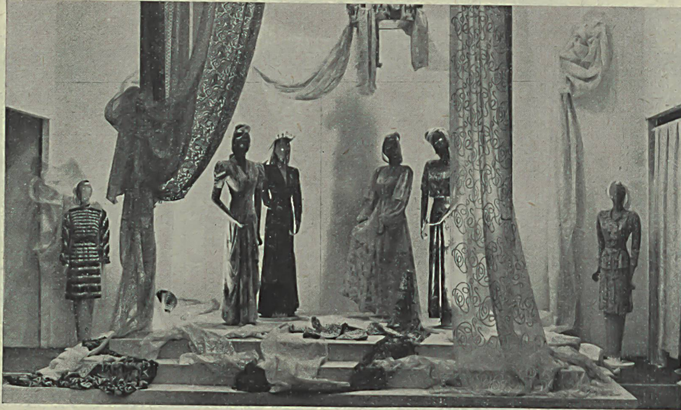
A l'Exposition Suisse de Lisbonne 1943.