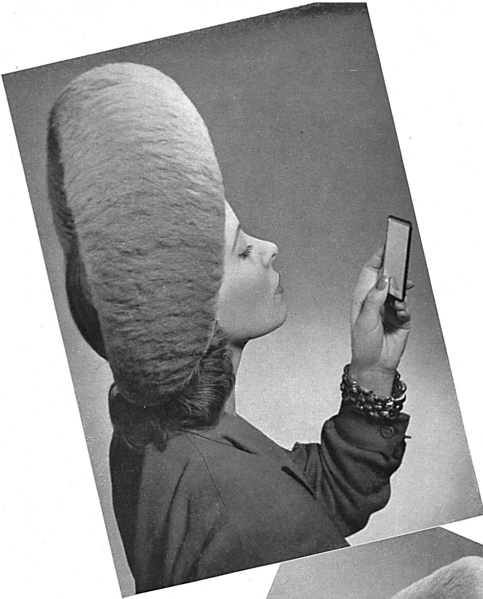
Modell Modèle Bema.

zeigen vier Modellhüte aus « FIBRANGOR ». Das neue Material, bereits für die Wintersaison 1944/45 vorbereitet, eignet sich vorzüglich für Atelierhüte, hat einen sehr schönen Griff und seidenweichen Glanz.