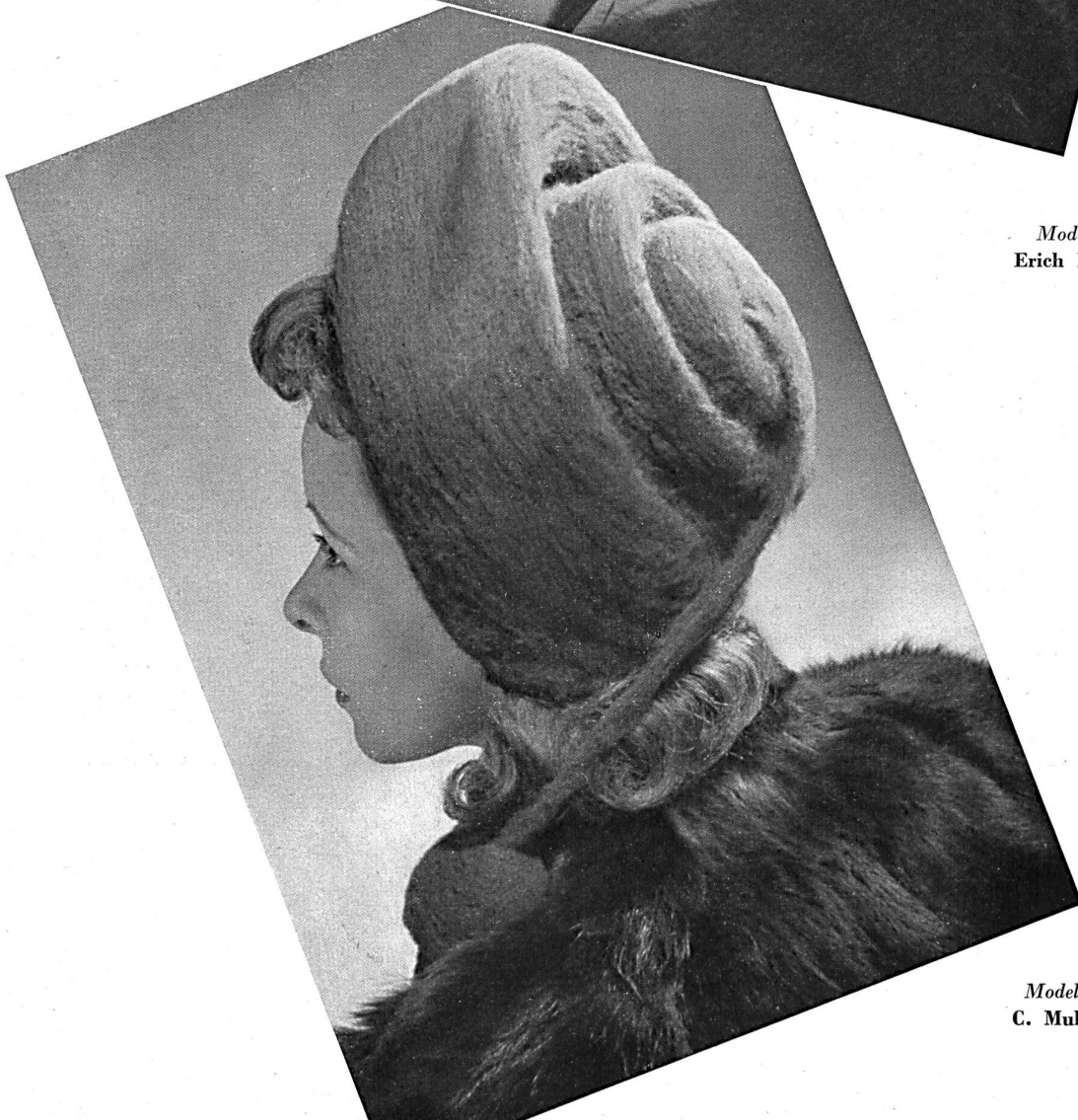
Modell Modèle C. Muller S.A., Zurich.