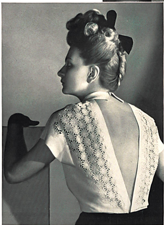
Union S. A., St-Gall. Dentelle. Lace. Encaje. Modèle Nina Ricci, Paris.