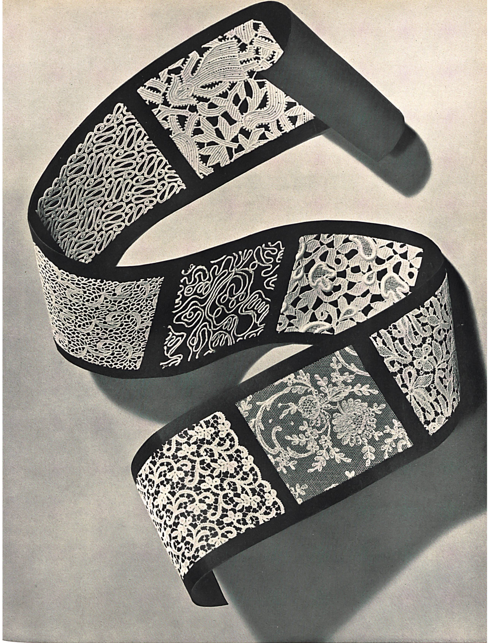
Walter Schrank & Cie, St-Gall. Dentelles classiques et modernes. S. T. Studio.