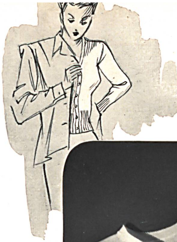
Ruegger & Cie, Zofingue. Boléro à manches longues pour dames. S. T. Studio.