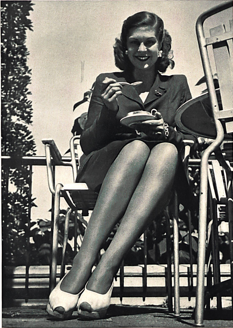
Manufactures de Bas Réunies S. A., St-Gall. Bas « FLEXY » pour dames. Photo Wolgensinger.

Lion & Cie, Kreuzlingen Quelques beaux articles en laine. S. T. Studio.