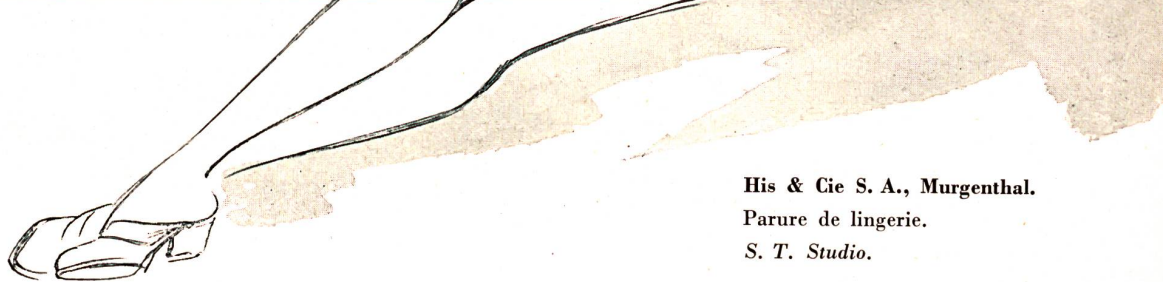
His & Cie S. A., Murgenthal. Parure de lingerie.