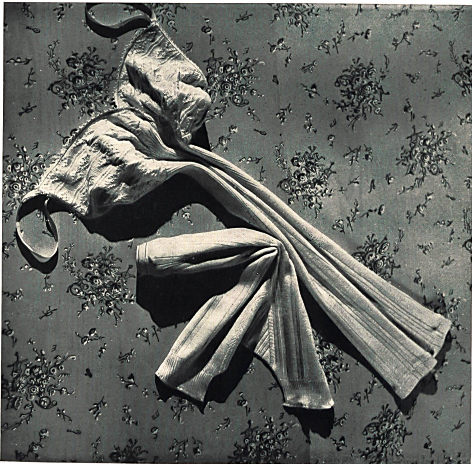
S. A. ci-devant W. Achnich & Cie, Winterthur. Parure fantaisie « SAWACO », pure soie ; façon soutien-gorge, culotte renforcée. S. T. Studio.