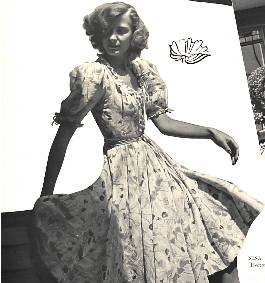
NINA RICCI Heberlein