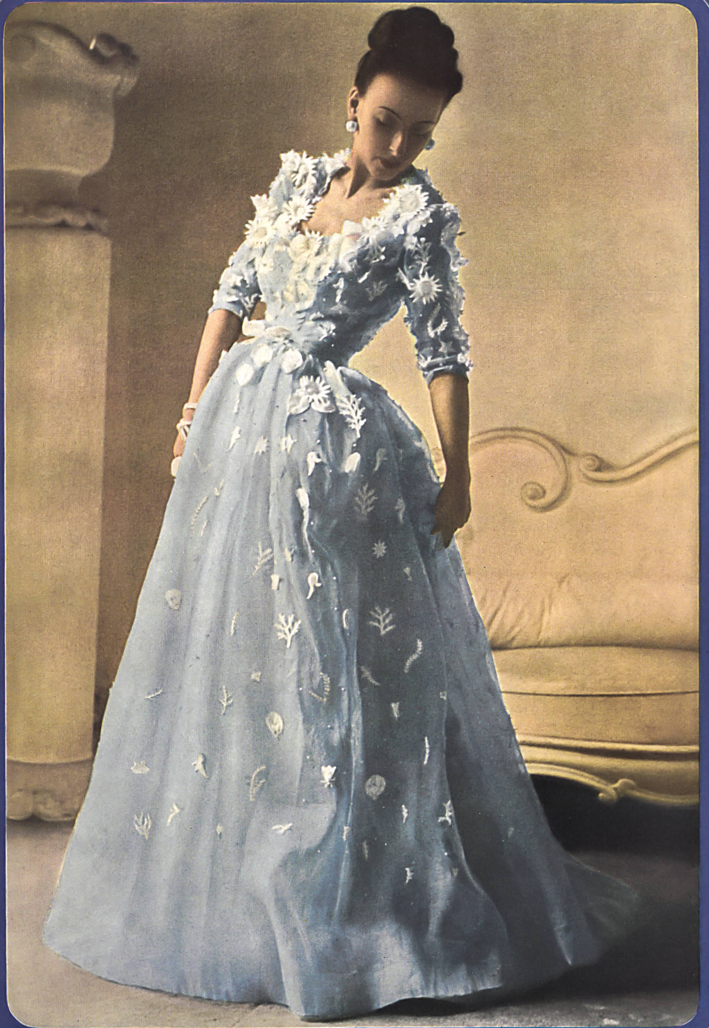
BALENCIAGA Aug. Giger & Cie. St-Gall