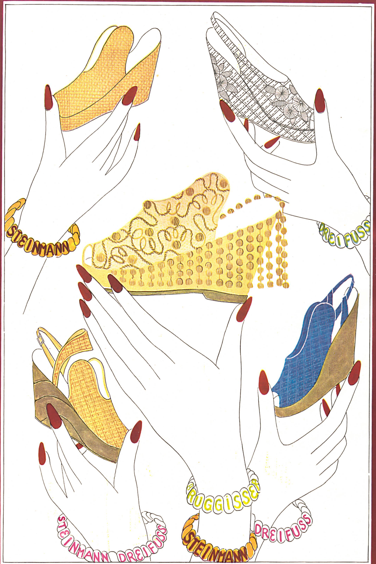
LÉANDRE Pailles de Wohlen