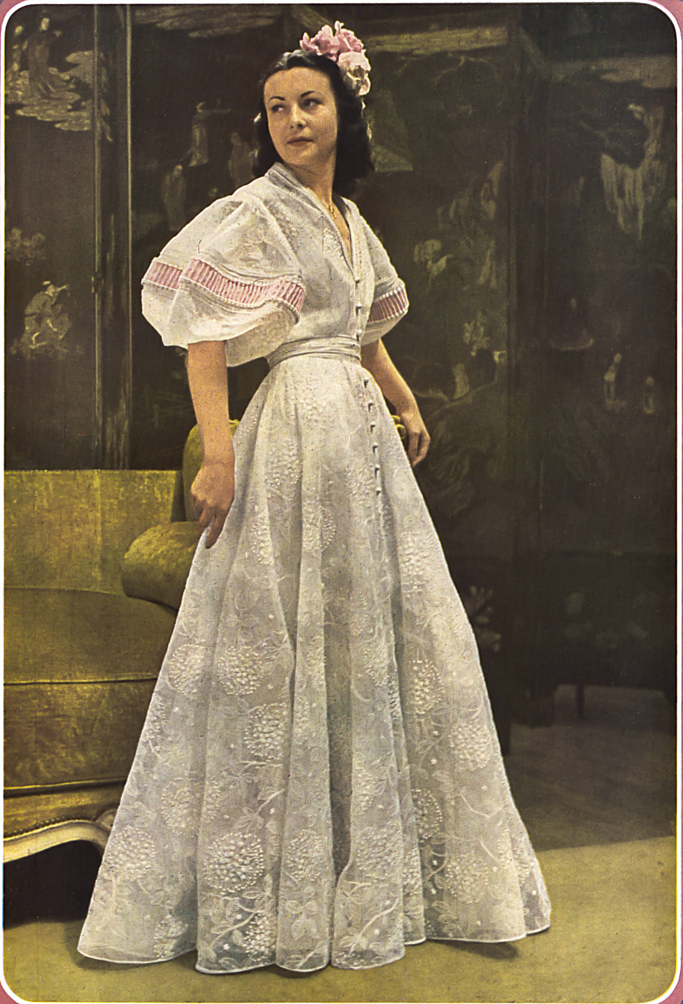
BRUYÈRE Reichenbach & Cie. St-Gall