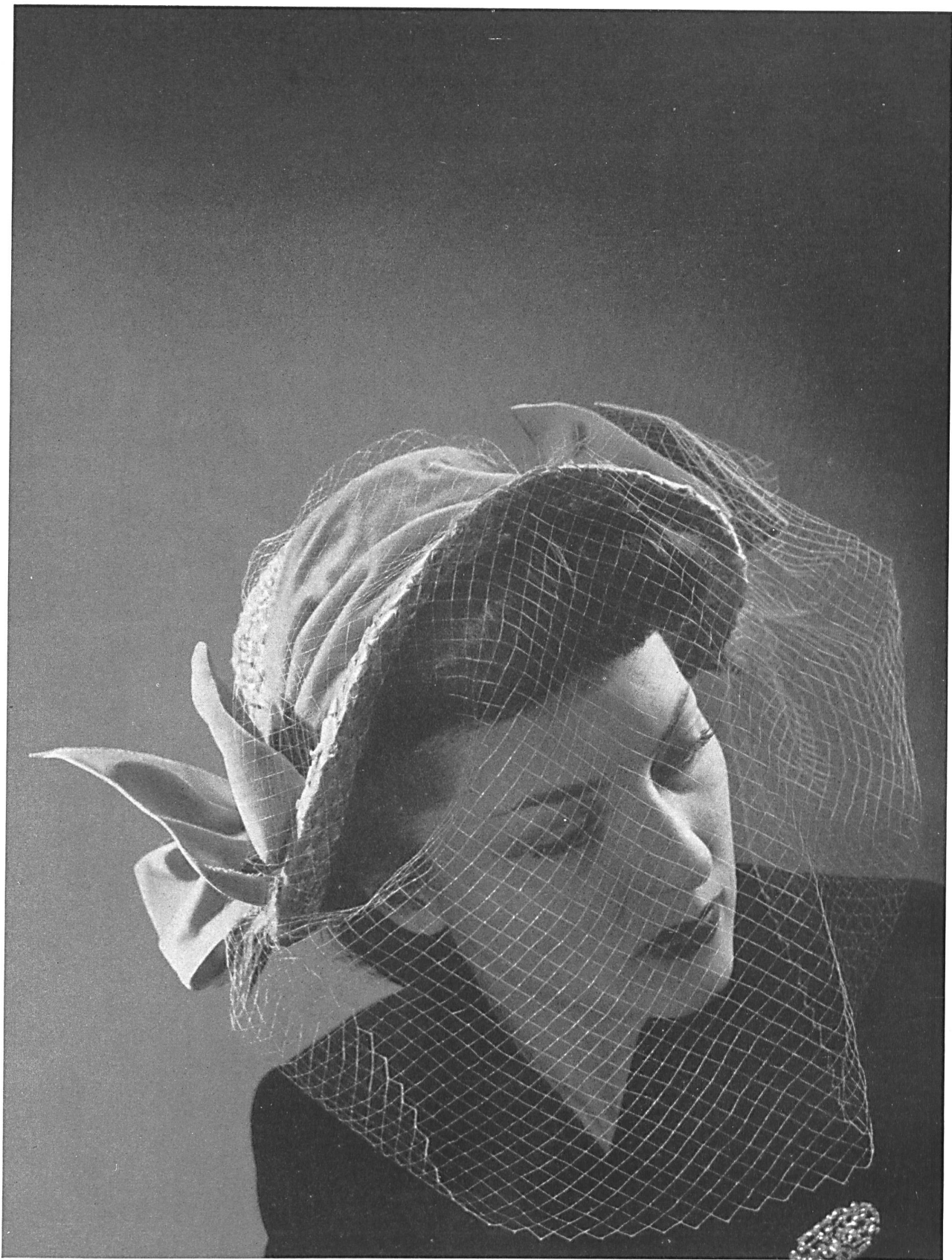
Stäger & Cie S. A., Villmergen Chapeau en tresses de paille Modèle Baehler, Berne