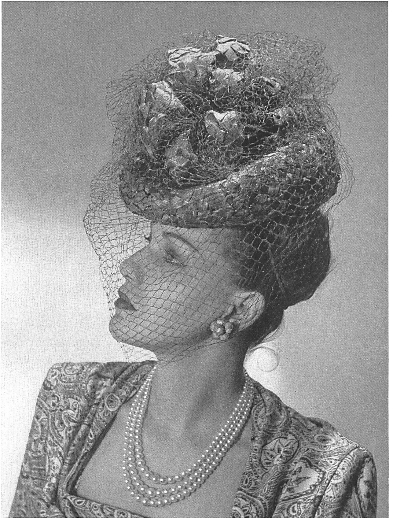
M. Bruggisser & Cie S. A., Wohlen Tresses de paille «YOWA» Création: J. & R. Polla, Zurich