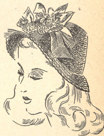
4. Chapeau de paille suisse de K. G. Hat Mfg. Co.