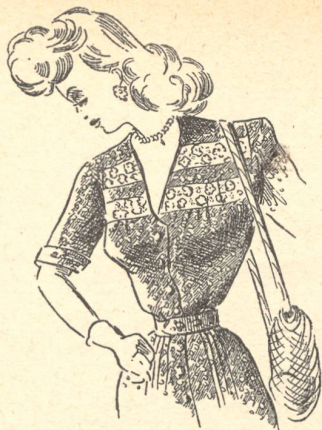
3. Modèle Mc Cutcheon's en « dotted swiss ».

la qualité . Les grossistes et les détaillants américains signalent tous que leurs clientes sont devenues « quality conscious », et qu'elles ne se contentent plus d'un tissu quelconque pourvu qu'il ait une jolie couleur. La perfection de la matière, du tissage, du finissage, de la teinture sont des qualités fondamentales qui donnent à un tissu sa valeur réelle et à une robe son chic inimitable. C'est ce que les industries suisses peuvent offrir aux femmes de goût, à celles qui savent apprécier la véritable élégance.