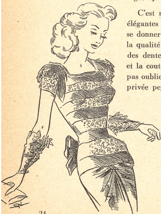
2. Robe du soir, création originale de Boué Sœurs, New-York — « Glamorous Evening » corsage de dentelle d'or et tulle brun sur une jupe de taffetas brun avec pouf drapé et noué dans le dos.

C'est naturellement dans les longues robes du soir et de dîner, dans les élégantes robes d'intérieur que la fantaisie des créateurs de modèles peut se donner libre cours pour interpréter ces tendances nouvelles. Et c'est dans la qualité inimitable des soieries, des fines batistes de rayonne, des organdis, des dentelles et des broderies importées de Suisse que la haute confection et la couture américaines trouvent un auxiliaire précieux (fig. 2). Il ne faut pas oublier que si la mode est à la recherche de l'effet, la femme américaine, privée pendant plusieurs années des articles de luxe, est à la recherche de