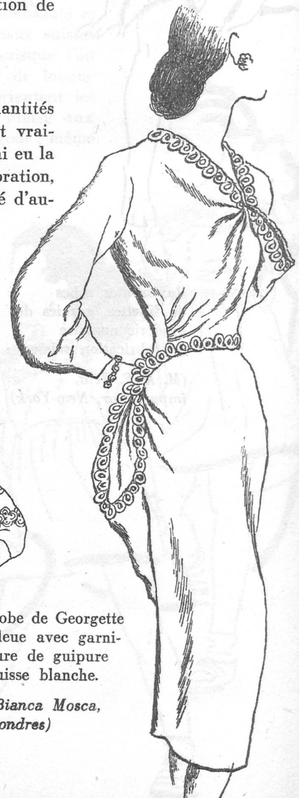
Robe de Georgette bleue avec garniture de guipure suisse blanche.