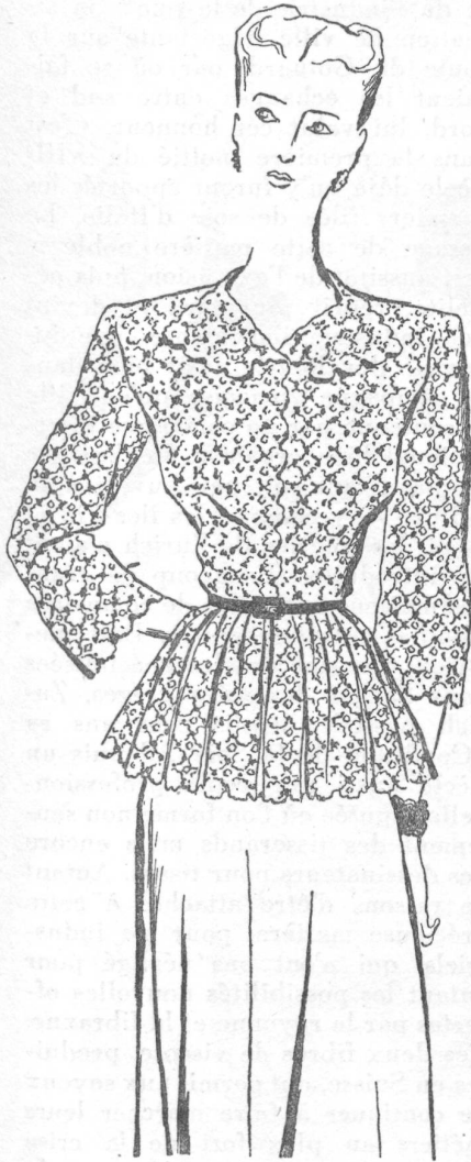
Casaque de guipure suisse, portée sur une jupe de jersey rayonne noire.