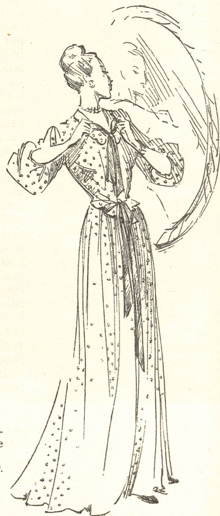
Négligé en broderie anglaise sur batiste blanche, avec manches bouffantes, et rubans de satin bleus et roses. (Modèle Mme Terzi, chez Bergdorf Goodman).

La perfection des créations suisses n'est pas un effet du hasard mais le résultat de l'expérience séculaire acquise par les ouvriers du textile de St-Gall, de Zurich, d'Appenzell ou de Bâle.