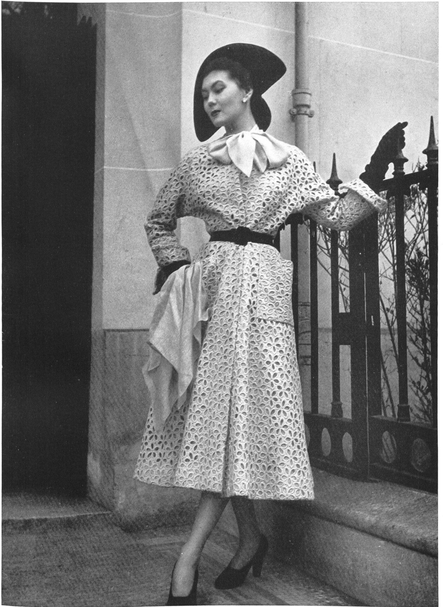
CHRISTIAN DIOR Forster Willi & Cie, St-Gall INAMO, ZURICH