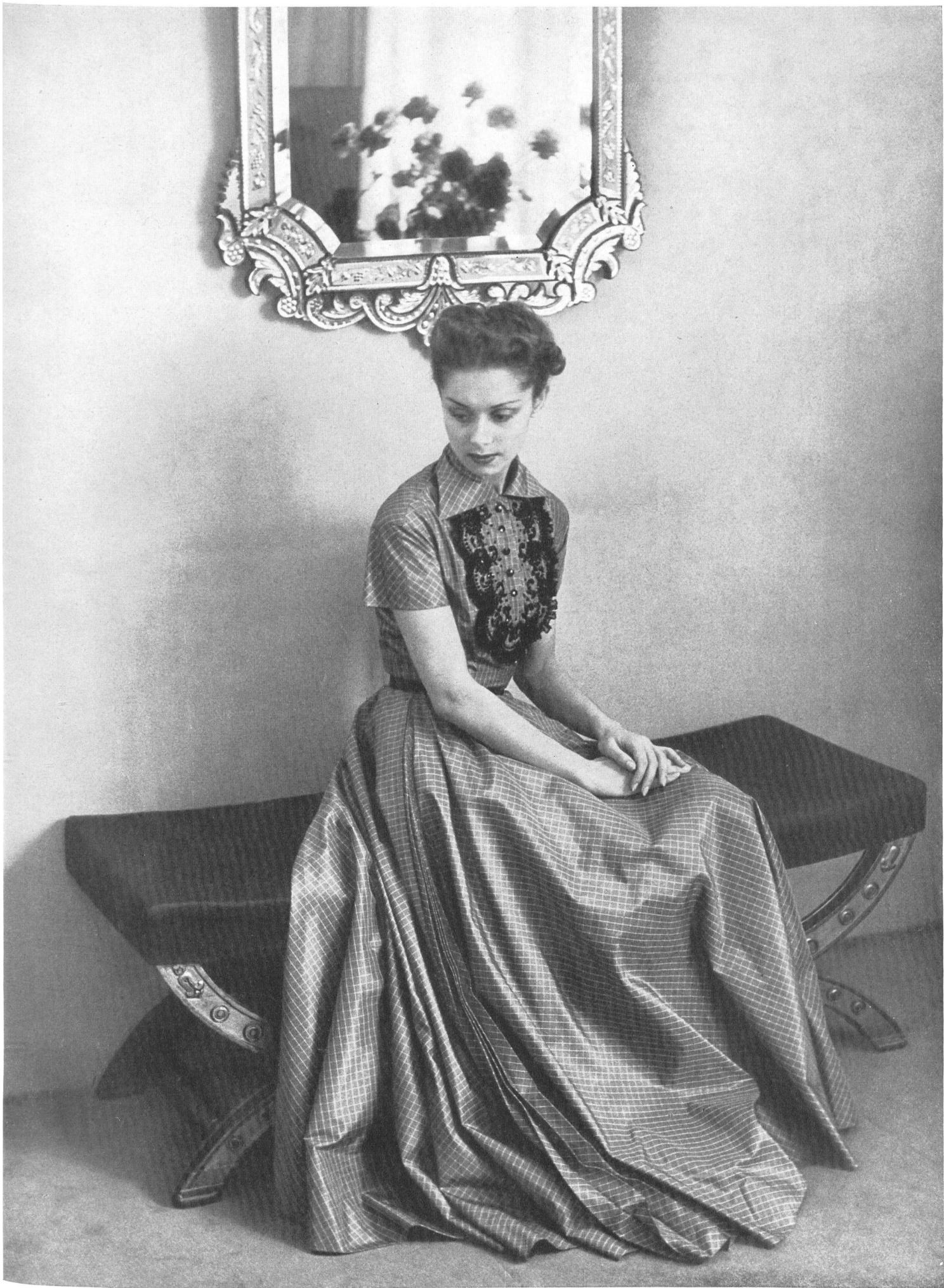
PIERRE BALMAIN L. Abraham & Cie, Soieries S.A., Zurich