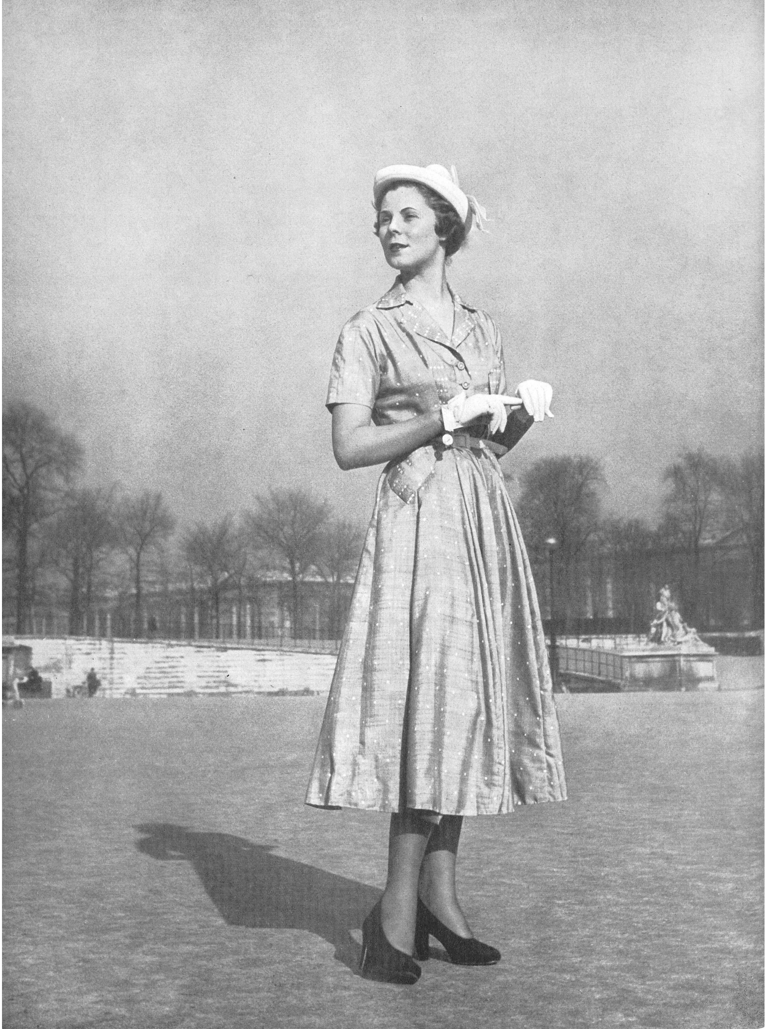
JACQUES HEIM L. Abraham & Cie, Soieries S.A., Zurich