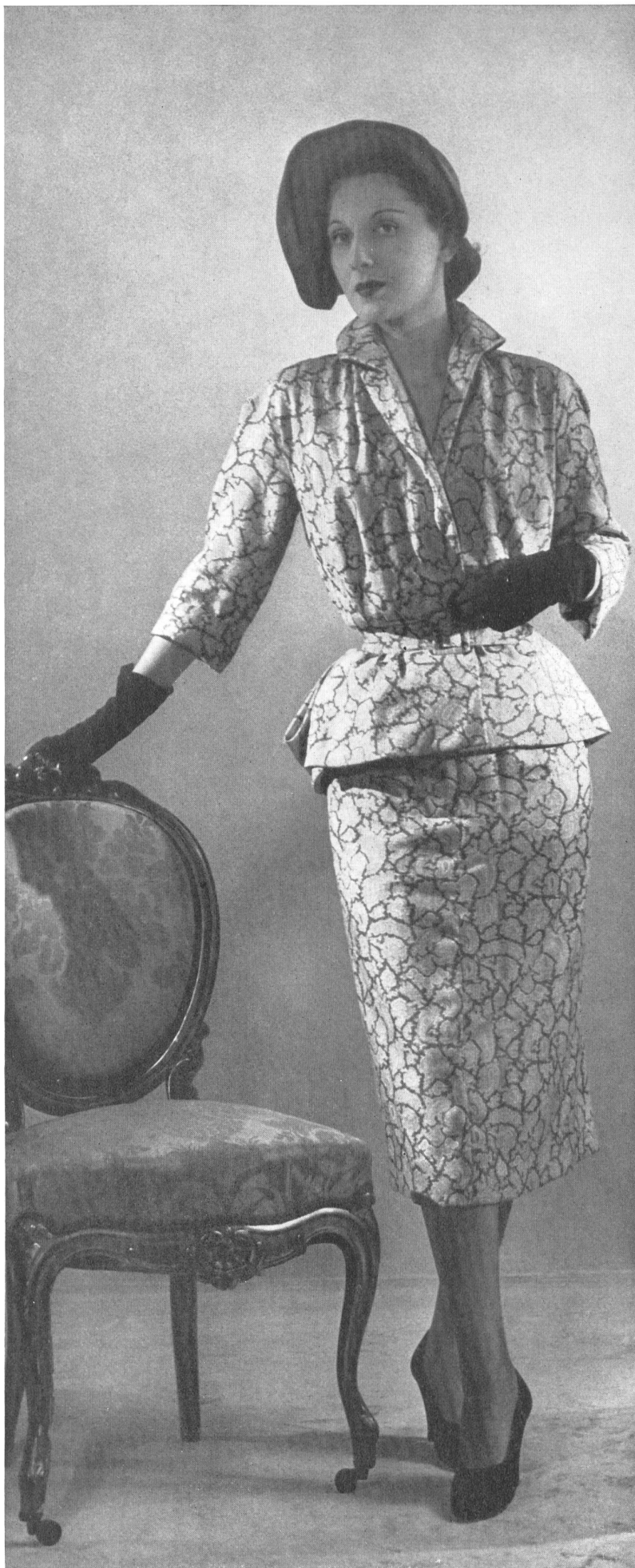
JACQUES GRIFFE L. Abraham & Cie, Soieries S.A., Zurich