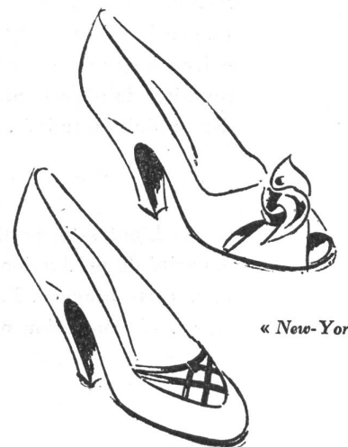
« New-York »