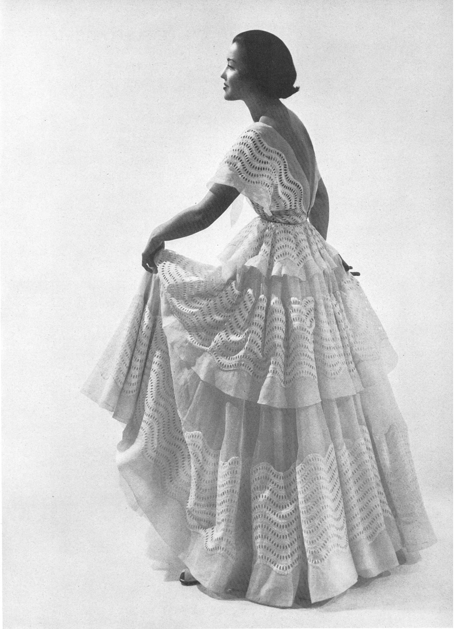
NINA RICCI J. G. Nef & Cie, Hérisau M. GUITRY, PARIS