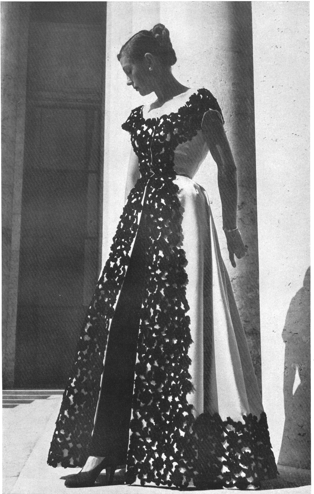
BALENCIAGA A. Naef & Cie, Flawil— INAMO, ZURICH