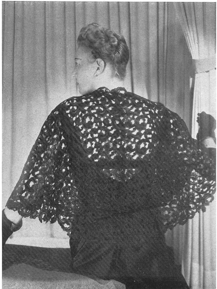
RAPHAEL Hufenus & Cie, St-Gall PIERRE BRIVET FILS, PARIS